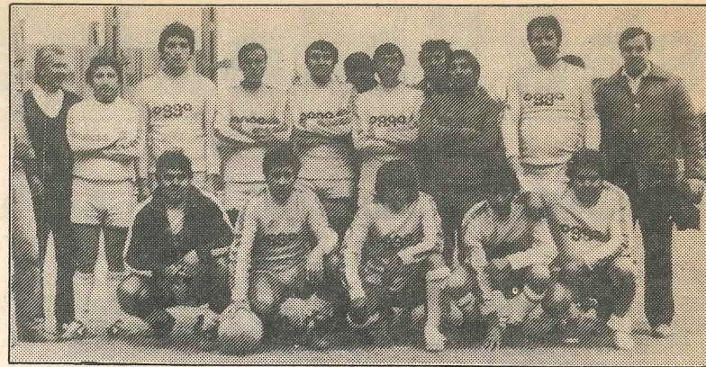
El plantel de Espacios Verdes "B"