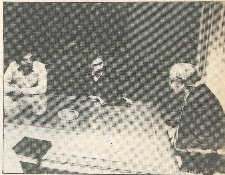
Nuevamente el SUOEM llevó sus reclamos ante el jefe de la Comuna