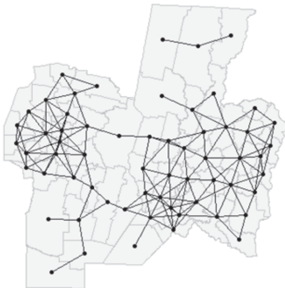
Gráfico 1. Región Centro: mapa de vecindad