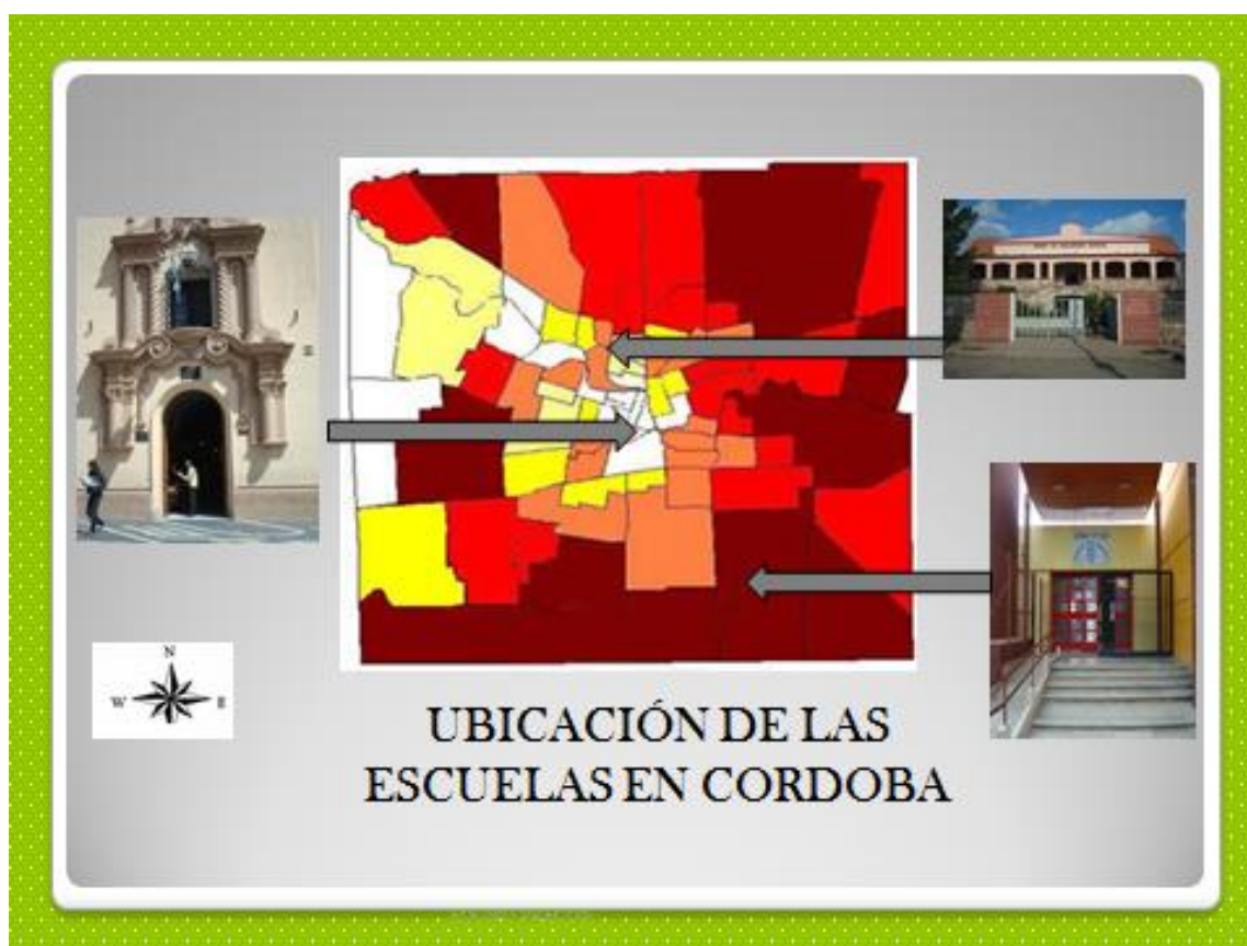
FIG 1: Ubicación de las escuelas en el mapa IVE.

Dicha propuesta surge en respuesta a una encuesta que daba cuenta un elevado número de jóvenes carentes de asientos, la que se convierte en la motivación fundacional de la escuela secundaria tal cual funciona en la actualidad. Se compone de aproximadamente 662 alumnos distribuidos en dos turnos, mañana y tarde. La población actual proviene de los sectores populares de la zona noroeste 7 tales como Barrio Arguello, Los Boulevares y con menor incidencia, jóvenes de otros barrios de Córdoba (dato suministrado por el relevamiento realizado por el gabinete psicopedagógico de la propia institución). Ingresan además algunos alumnos repitentes de otros colegios privados de la zona.