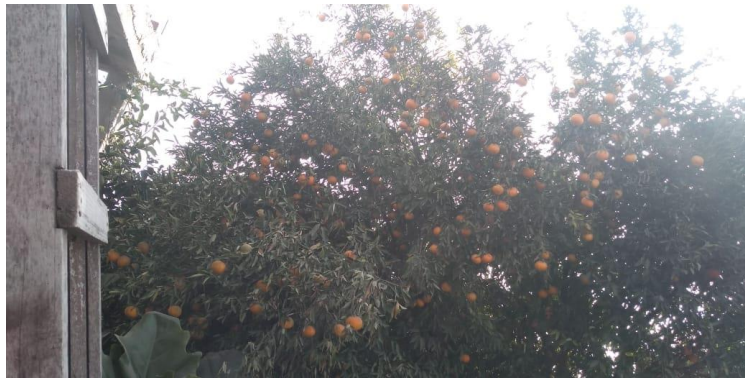
Árbol de mandarina criolla. (Foto parcial de Huerta familiar. Fuente: Pilar, junio 2020).