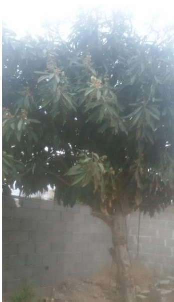
Árbol de Níspero. (Foto parcial de Huerta familiar.)