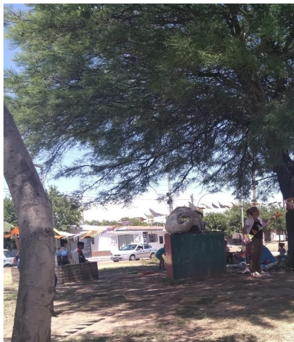
Feria Comunitaria. Plaza de CDMS. Árbol de algarrobo que ofrece sombra a feriantes y vecinas/os (diciembre, 2019).

Contribuciones de la feria comunitaria, la huerta familiar y la huerta comunitaria, como estrategias alimentarias, a la seguridad alimentaria de los hogares desde la percepción de las mujeres del Barrio Ciudad de Mis Sueños