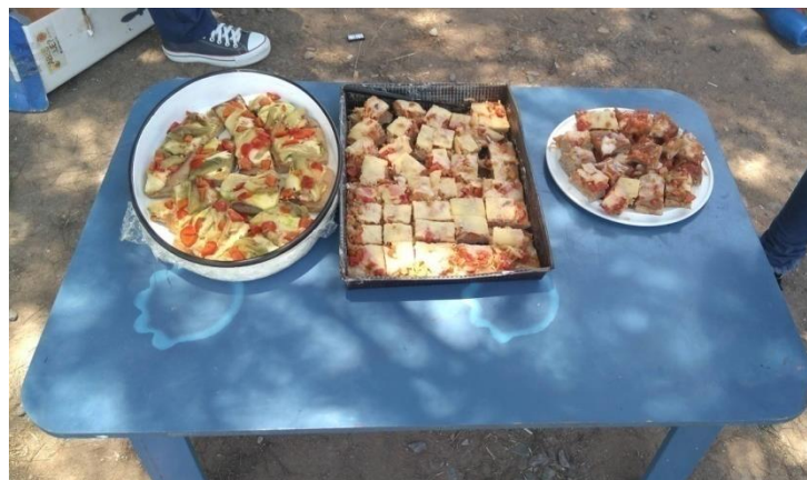
Festejo de cumpleaños de la feria con pizzas de berenjena e integrales (diciembre 2019).