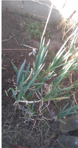
Planta de cebolla de verdeo y de menta. (Foto parcial de Huerta Familiar. Fuente: Pilar, junio 2020)