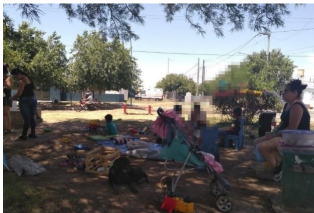
Niños jugando y feriante (diciembre, 2019).