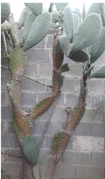
Árbol de Tuna. (Foto parcial de Huerta Familiar.)