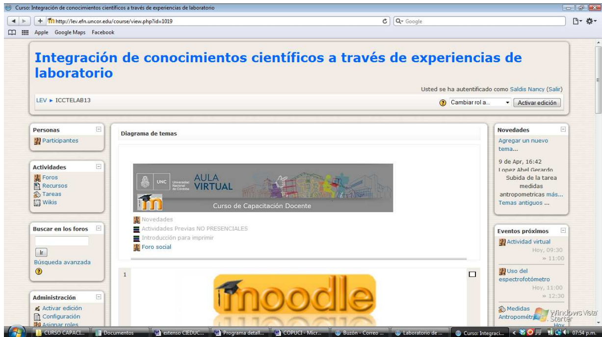
Figura 5. Vista del aula virtual preparada para profesionales.

Los logros en la enseñanza se reflejan en el resultado del aprendizaje.