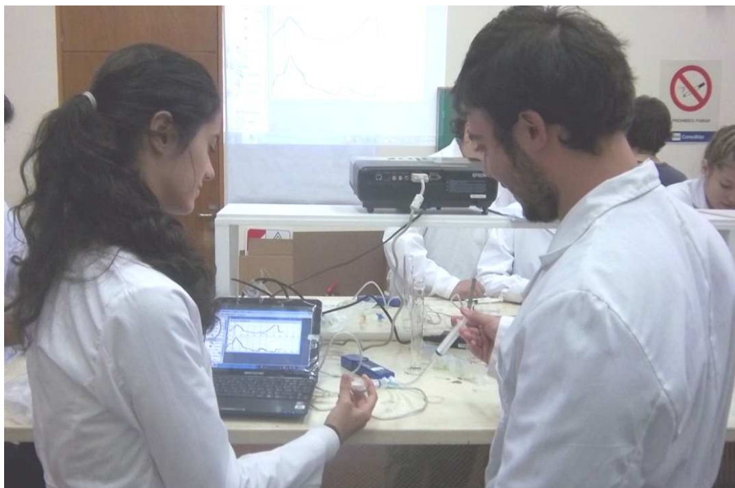
Figura 3. Estudiantes participando de los talleres.

El "Taller de sensores asistidos por DataStudio" fue incluido en las propuestas de disertación del XVIII Congreso Latinoamericano de Estudiantes de Ingeniería Química realizado en el mes de agosto de 2012 en la FCEyN con 8 horas de duración y un máximo de cupo con una asistencia de 20 estudiantes y 3 docentes de diversos países. La encuesta realizada a los asistentes comprobó que los recursos TICs empleados en el taller no están siendo aplicados en otras universidades latinoamericanas resultando innovadores como así también las actividades propuestas.