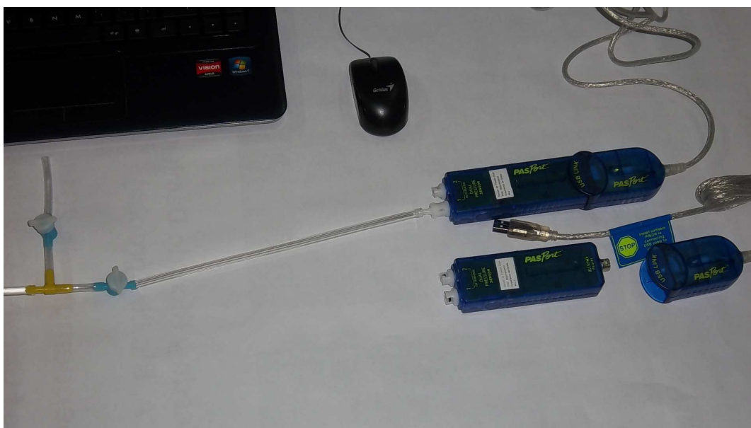
Figura 1. Recursos TICs sensores e Interfases Passport

Para lograr la elección de los recursos TICs para el aprendizaje mediado, se relevaron los distintos equipos y sensores electrónicos disponibles en el mercado. Luego de un análisis de costos, calidades y factibilidades se adquirieron sensores múltiples marca Pasco de uso didáctico para efectuar determinaciones de temperatura, pH, conductividad, presión dual y oxígeno disuelto, sus interfases USB Passport y las netbook para el trabajo con el software DataStudio que permite la adquisición y procesamiento de los datos en tiempo real. Los recursos didácticos TICs se seleccionaron con la convicción que serían elementos atractivos para los estudiantes y por ende motivadores del aprendizaje.