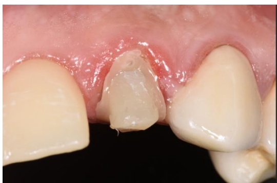
Figura 5. Poste y núcleo cementado con cemento autoadhesivo.

Una vez corroborado el ajuste, se efectúa el cementado. (Figura 5)