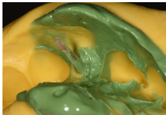
Figura 2. Impresión del conducto y remanente dentario con endoposte como soporte del material de impresión.

, Coltène/Whaledent AG, Suiza) consistencia pesada y liviana, utilizando el propio endoposte como alma de soporte para la silicona liviana que reproduce el espacio interno del conducto para evitar posibles distorsiones al momento de la confección del modelo. (Figura 2)