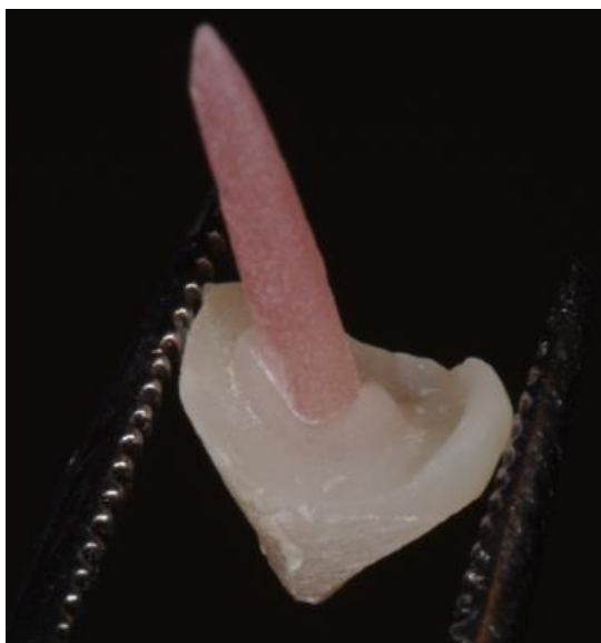
Figura 4. Poste y reconstrucción con resina del pilar coronario.

Una vez conformado el núcleo coronario se retira del modelo flexible (Figura 4) y se procede a la prueba en boca sobre el pilar dentario preparado.