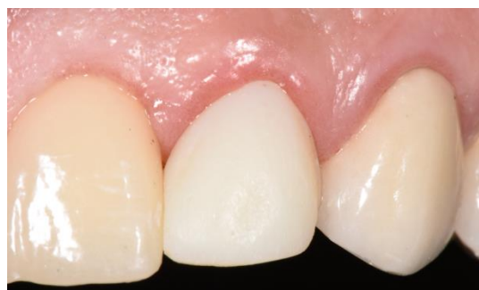
Figura 7. Provisionalización inmediata con resina Bis Acrílica.

Confeccionada la restauración coronaria cerámica en laboratorio se realizó el cementado de la misma con técnica de cementado adhesivo mediante cemento de resina dual. (Figura 8)