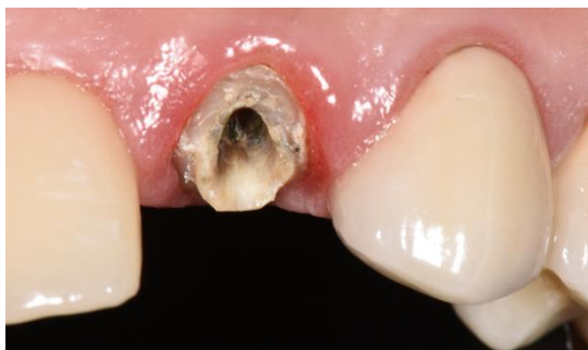
Figura 1. Estructura dentaria remanente y espacio del conducto preparado.

Se presenta a consulta un paciente de sexo masculino con el desprendimiento de una restauración coronaria y perno metálico colado en posición elemento 22 con remanente coronario reducido y conducto preparado con espesor dentinario radicular reducido. (Figura 1)