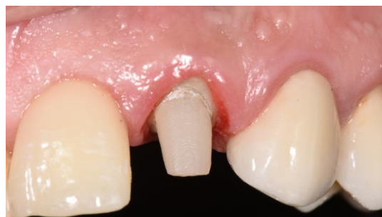
Figura 6. Pilar y remanente dentario preparado.

Se realiza la preparación del pilar y remanente dentario para una restauración de cerámica sin metal, provisionalización con resina bis-acrítica (Cooltemp-Coltène/Whaledent AG, Suiza), a partir de matriz previamente confeccionada y se efectúa impresión definitiva con técnica de doble impresión. (Figuras 6-7)