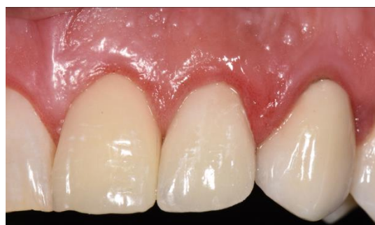
Figura 8. Restauración definitiva cerámica.

Confeccionada la restauración coronaria cerámica en laboratorio se realizó el cementado de la misma con técnica de cementado adhesivo mediante cemento de resina dual. (Figura 8)