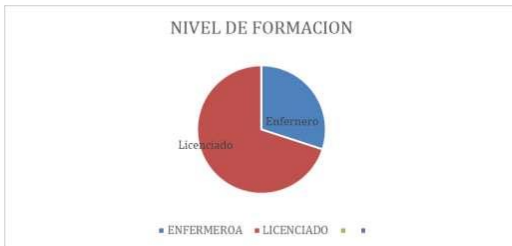
Grafico C: Nivel de Formación de los Enfermeros del servicio de Covid-19 del Hospital de Niños Santísima Trinidad de la provincia de Córdoba, segundo semestre del 2022.