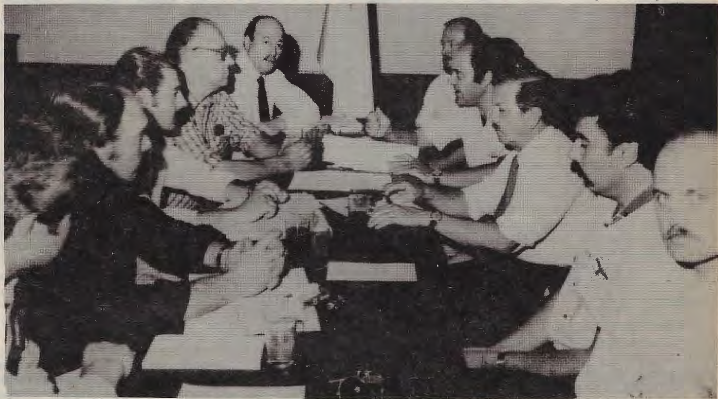
En el contexto de la celebración del cincuentenario de la Asociación Patronal de Quinteros de Florencio Varela, las 30 entidades nucleadas en el Frente Agrario emitieron un nuevo pronunciamiento, reafirmando el apoyo a "todos los esfuerzos que se realicen para lograr la normalización institucional del país".

Tanto en Mendoza como en Florencio Varela, esta última ciudad ubicada al sur del Gran Buenos Aires, los dirigentes que tratan de plasmar la iniciativa produjeron sendos documentos en los que enfatizaron su propósito de defender "los legítimos intereses del pequeño y mediano productor de toda la república", así como apoyar también la "recuperación y el desarrollo de las economías regionales como una de las formas básicas de defender la soberanía nacional".