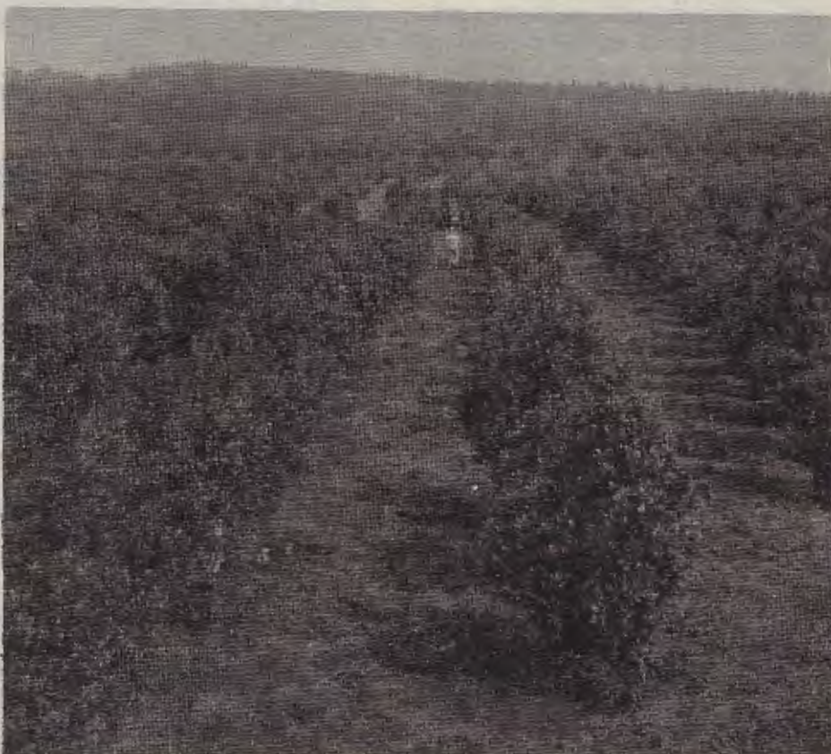
La yerba mate, un cultivo básico de la producción misionera. También fué víctima de la crisis desatada por la política económica oficial.

La Unión Cívica Radical (UCR) y el Partido Justicialista (PJ), respectivamente, organizaron un Congreso Agrario en la localidad de Aristóbulo del Valle y progra-