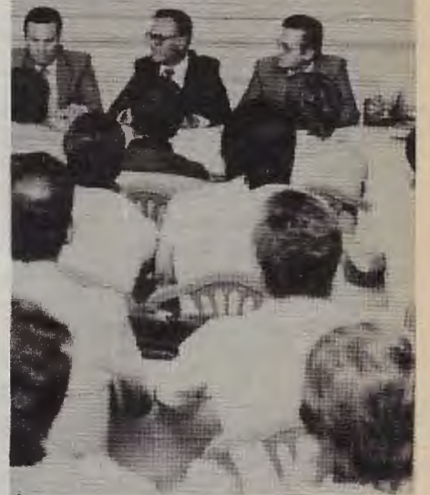
La nota gráfica muestra uno de los momentos del Encuentro de ADIFACA, que reunió en Rosario a decenas de jóvenes cooperativistas.

JORNADAS DE POST GRADO IDONEOS EN LA ADMINISTRACION LAS COOPERATIVAS AGRARIAS DAFAC • FAC