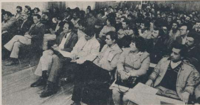
Vista parcial de los participantes de la Jornada.

Hacer una acción coordinada de creación de tecnología entre INTA,