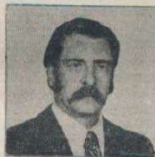
Escribe Oscar M. Bracerías

Para ello elige (tanto para él como para su Obispado),