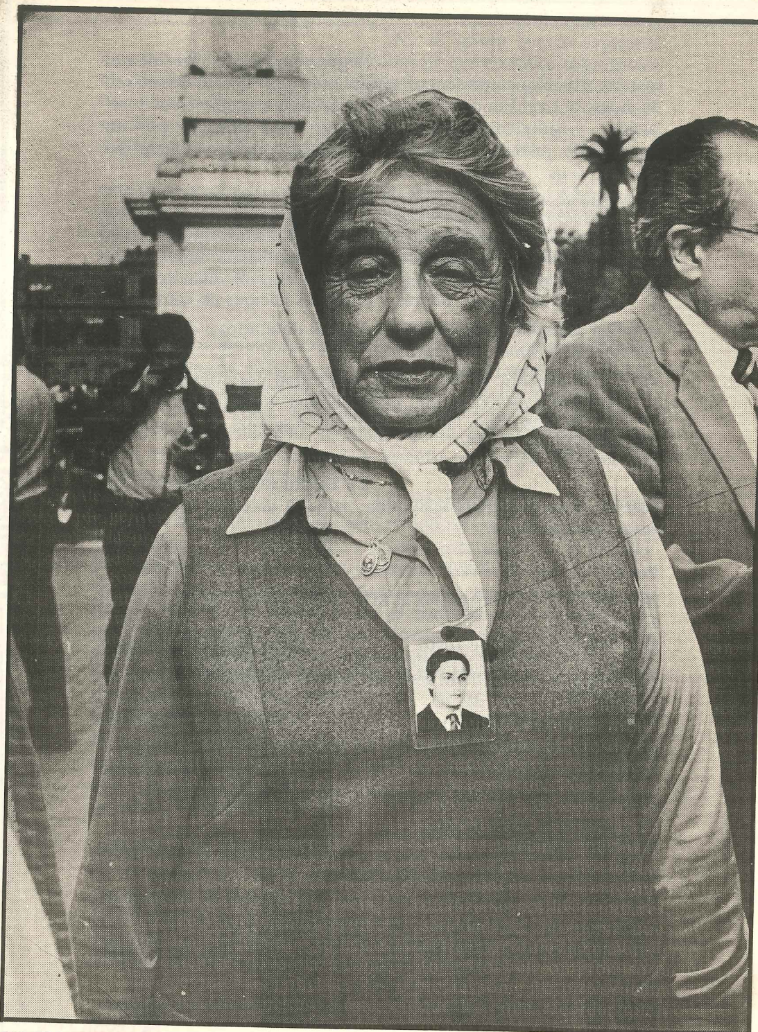
12 - INFORMEDH