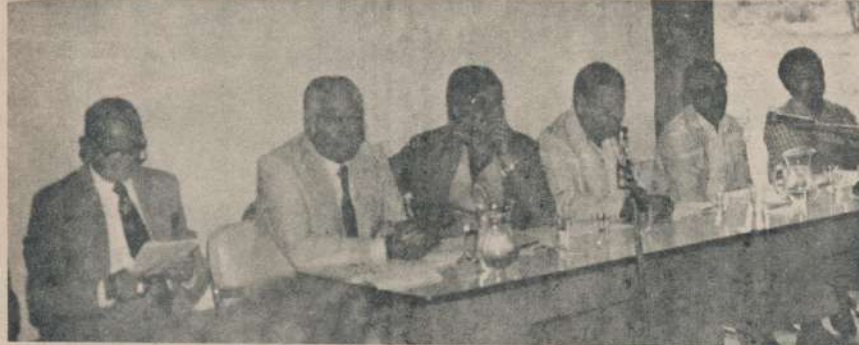
Ofrecemos aquí las características de una cooperativa cañera de pequeños y medianos productores, muchos de ellos minifundistas, que han logrado soportar estos últimos 7 años a pesar de los muchos obstáculos que se le impusieron al movimiento cooperativo.

C.N.: ¿Cuáles son las características de la cooperativa?