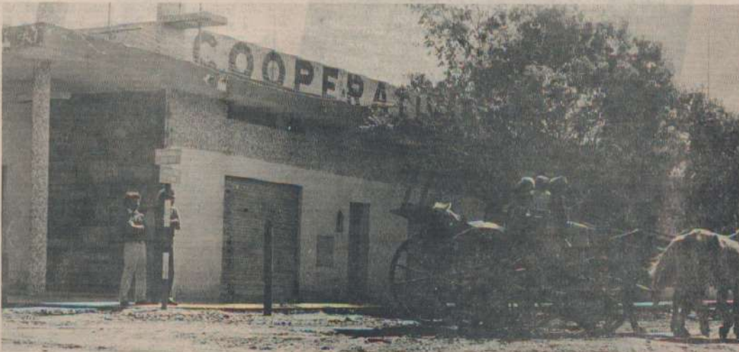
Cooperativa de Pampa del Infierno, antes una de las más importantes de UCAL, hoy con una deuda de varias decenas de millones de pesos.

Pero la resistencia popular obligó a retroceder a la dictadura oligárquica. Y con la lucha de todos los sectores nacionales conquistamos la democracia. Ha llegado la hora de enjuiciar y castigar a los responsables. Los asesinos del Terrorismo de Estado y los ladrones con guante blanco deberán comparecer ante la Justicia. Es preciso reparar el daño causado al pueblo trabajador. Sólo así desaparecerá la amenaza de una nueva traición a la patria. Sólo así los hijos del éxodo volverán a hacer retumbar su alegre sapucay en los quebrachales. Sólo así podrán volver a la tierra que los vio nacer, a sembrar la semilla de la esperanza de un país libre y un Chaco mejor.