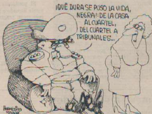
Extraído de Humor