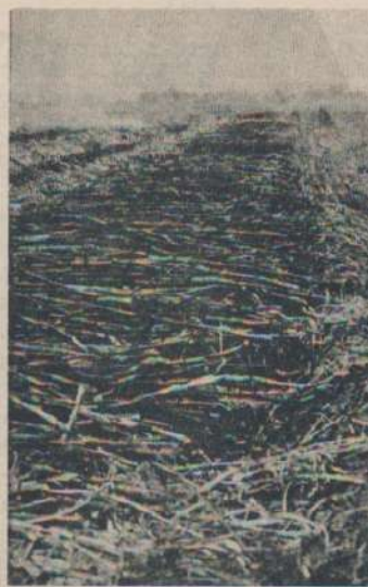
Cosecha de caña de azúcar semimecanizada

A.S.: Lo fundamental es el manejo fuera de la ley. No se cumple esta ley que ha sido criticada por el gremio por injusta. En lo que respecta al pago del 70% al contado y el 30% a 180 días, no se provee la financiación para la zafra. Se hace azúcar fuera de la ley, azúcares negros o no gravados y los beneficios no son más que para el dueño del ingenio, no es un beneficio para la fábrica porque las ganancias no se las incorpora como capital, tampoco para el Estado ya que no se cobran impuestos, menos lo es para el cañero que le pagan como quieren. Es un azúcar con caña barata y está fuera de cupo, es un cupo del productor cañero y se miente cuando se dice que en el mercado hay un millón trescientos cincuenta mil toneladas y en el mercado seguro que hay un millón quinientas mil toneladas o un millón seiscientos mil toneladas, ya es incalculable. Esta situación beneficia a sectores comerciales e industriales porque si es una ganancia que no se invierte en Tucumán, está descapitalizando a Tucumán