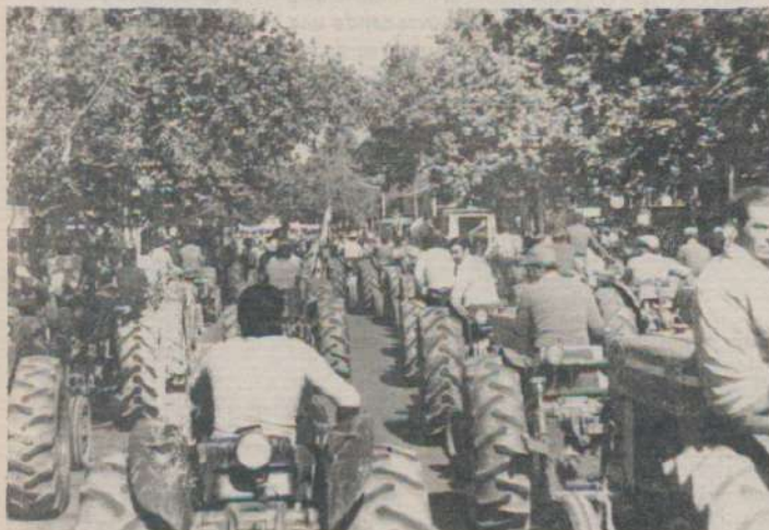
La movilización de los productores con sus herramientas por los caminos de la provincia, es una forma de lucha para hacer oír sus reclamos.