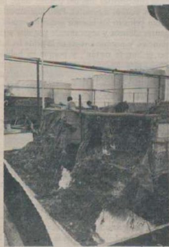
El fruto del trabajo y esfuerzo del productor es volcado a las tinajas para ser molido y convertido en vino.