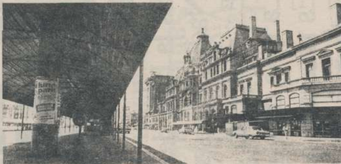
Imagen de la total adhesión que tuvo el paro general realizado el 4 de octubre pasado

Un gobierno al que el país le reclama urgentes mejoras salariales y sociales, declara no poder dar respuestas a los pedidos gremiales, pero por otro lado puede empeñar al país dando obsecuente respuesta a la banca internacional.