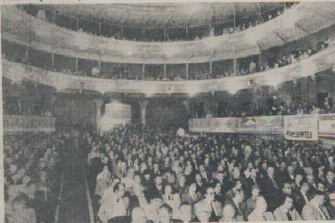
Vista de los delegados y público presente en el acto inaugural del Congreso.

"Este programa, sin espectacularidades, puede llevarse a la realidad de inmediato y sin subsidios económicos o financieros, conjugando la planificación con precios mínimos sostenidos obligatorios y en origen, partiendo de costos promedio más beneficiosos, con una paridad cambiaría ajustada a la realidad, con una política crediticia orientada y supervisada, con una reforma del sistema impositivo que estimule la producción y castigue la especulación y con la difusión de la tecnología disponible".