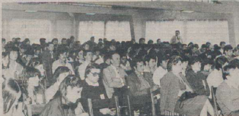
Vista de una parte de los casi 400 jóvenes asistentes al Seminario.

Finalmente, el sábado 24 se realizó la Asamblea General Ordinaria, donde también quedó constituido el nuevo Consejo Central de Juventudes y a la noche se realizó la tradicional Fiesta de la Amistad con elección de la reina.