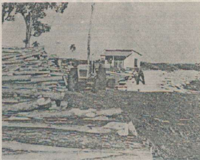
La actividad forestal es también una importante fuente de riquezas para la provincia, que junto a la producción agrícola forman la principal fuente de divisas.