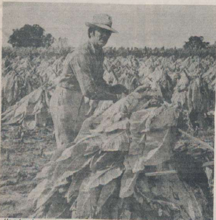
Un colono levantando el fruto de su esfuerzo, que luego, por falta de políticas que lo protejan, debe malvenderlo, ya que la comercialización está monopolizada por dos compañías multinacionales.

Nota: debido a problemas en el correo no podemos publicar las fotos, que prometemos para el próximo número.