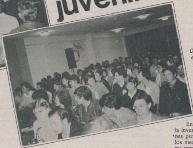
Los momentos del encuentro en que los jóvenes agrarios entrerrianos trataron sus problemas y elaboraron las propuestas que a su humilde entender, son las soluciones a los problemas del sector agrario.

Bajo el lema "La suerte de las Naciones depende directamente del grado de capacitación de sus hijos" se desarrolló en el mes de agosto, el primer encuentro de jóvenes agrarios de la provincia de Entre Ríos, organizado por la Juventud de Federación Agraria Argentina. Durante el transcurso del mismo los jóvenes estuvieron abocados a la tarea de ver y analizar cuáles son los principales problemas de la juventud agraria y del país, lo cual sirvió para la elaboración de las propuestas hechas por el encuentro.