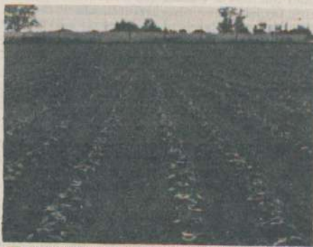
“Se debe legislar en forma específica la comercialización de forma tal que no sean los exportadores y los importadores los que pongan el precio”

“En este momento el mayor problema es la comercialización. El productor produjo durante 6 años, a pérdida, la venta no cubrió los costos de producción, y fuimos perdiendo nuestro patrimonio. Por desgracia casi hemos perdido la única arma que teníamos en la comercialización, que es nuestra cooperativa. Hemos quedado al libre arbitrio de cuatro firmas exportadoras, las cuales ponen el precio de acuerdo a lo que a ellas les conviene, y el productor ha quedado huérfano de apoyo en todo sentido. Si esto persiste definitivamente la producción pueda subsistir, por eso el principal objetivo de hoy es recuperar la cooperativa y ponerla en marcha nuevamente. Nuestra lucha fue dura, tuvimos que decir muchas verdades que a los “señores” gobernantes les molestaban, fue la primera Asociación del país que planteó esta situación al gobierno nacional, ya en el ‘78 cuando parecía que todos los otros sectores producti-