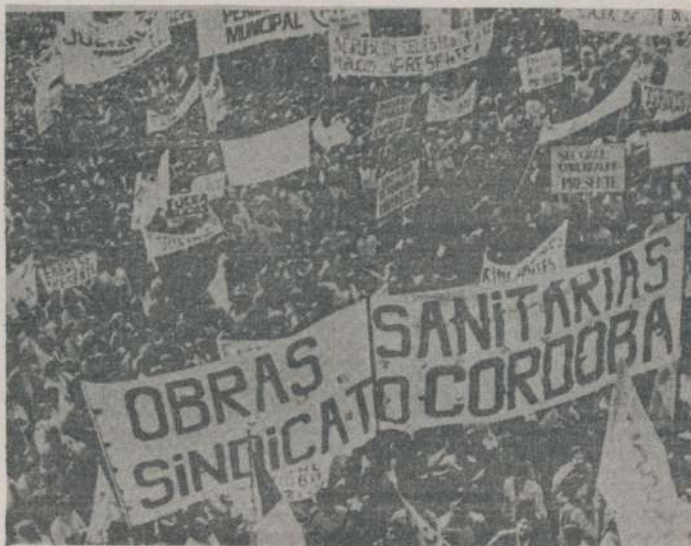
Manifestación de los obreros estatales de Córdoba, realizada el 2 de setiembre, pidiendo sueldo mínimo de 3.000 pesos.

Frente a estas y otras expresiones del poder, el conjunto del pueblo está exigiendo sus justos reclamos, respondiendo de esta manera que no permitirán de-