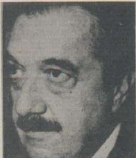
Raúl Alfonsín, candidato a presidente por la UCR.

■ “Incrementar las distintas producciones no pampeanas en función de las posibilidades del consumo y de la exportación con el apoyo del Estado Nacional en lo que se refiere a la infraestructura necesaria para lo cual se requiere una nueva concepción de las políticas de inversión pública”.