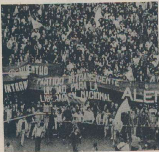
Una parte de la multitud de jóvenes que el sábado 2 de junio se manifestó por "la paz y la democracia" convocada por las Juventudes Políticas.