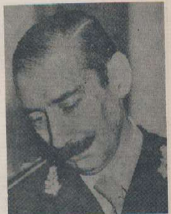
Jorge R. Videla, primer presidente del "Proceso", debió concurrir a tribunales para declarar sobre el caso Hidalgo Solá, al reabrirse la causa por desaparición del diplomático.

En síntesis, vemos que cada vez más militares y funcionarios del "Proceso" deben transitar por los pasillos de los tribunales, ya sea por acusaciones o como testigos, cosa que provoca cierta expresión de satisfacción y alivio en toda la opinión pública pues las cosas se resuelven dentro del marco que nunca debió salir, que es "la Constitución Nacional", donde sí, es posible lograr la igualdad de todos los seres humanos, a la vez que no permite que la corrupción, el miedo y la incertidumbre se adueñen de la Nación. Y esto el pueblo todo lo sabe y es por eso que ha elegido este camino y no la revancha y la anarquía.