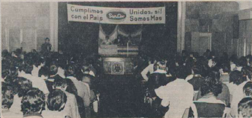
Pag. 6 - 7