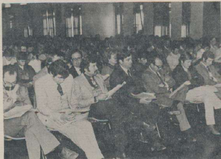
Parte de los 270 jóvenes que participaron de la convención, en el momento de aprobar el despacho final.

Que los objetivos específicos de la Federación son; la capacitación de los jóvenes agrarios mediante la convivencia, respeto mutuo y la elevación cultural, técnica y social. A la vez, debe ser la encargada de coordinar los planes generales de actividad. Para ello, esta comisión propone crear nuevos cursos combinados técnicos-doctrinarios y que la enseñanza se estructure de acuerdo a la edad y niveles de educación, como así también, que el lenguaje esté acorde con el nivel intelectual del grupo. Propone continuar con los