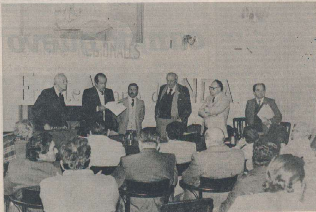
Momentos en que el vicepresidente del Frente del NOA lee la declaración de principios que servirá de guía en la acción del mismo.

12.- El cooperativismo por los principios que sustenta y por sus modalidades operatorias es una concepción social altamente beneficiosa para la comunidad y, en especial, para los pequeños y medianos productores, por lo que su difusión e integración debe estimularse mediante la legislación pertinente, y los adecuados aportes presupuestarios. Debe darse cumplimiento a la Ley Nacional Nº 16.587 que implantó la enseñanza del cooperativismo en las escuelas.