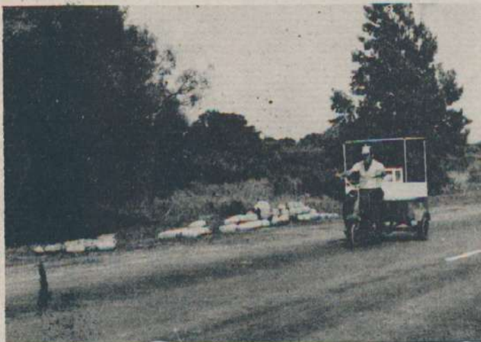
Puesta de venta ambulante; refleja la falta de planificación en la comercialización, ya que estos se multiplican por cientos a lo largo de todo el país.

10º) Debe llevarse a cabo un convenio entre la Provincia y Ferrocarriles del Estado, para que se diagrame y asegure una salida eficiente y económica de nuestra producción hacia los grandes centros de consumo, la experiencia que actualmente vivimos en que sufrimos graves pérdidas y trastornos por la falta de transporte para trasladar nuestros productos, hablan bien a las claras de las improvisaciones en que se incurren en este terreno, el desarrollo de las fronteras agropecuarias exigen un medio de transporte seguro y modernos.