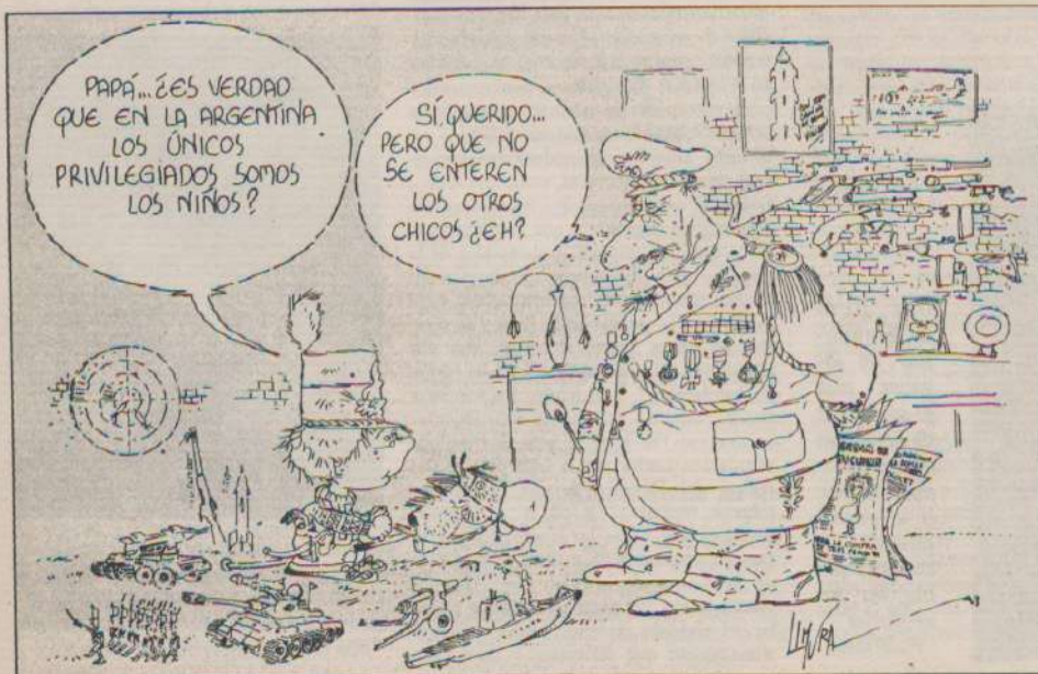
Extraído de Humor

se abocaron a la tarea de definir los objetivos y formas de organizarse para ir capacitándose y formándose para asumir el rol de ser protagonistas de su propio destino, como en la clausura lo manifestara tanto el presidente de Federación como el presidente de SanCor. Alentamos pues a éstos jóvenes agrarios a seguir el camino de la unidad, organización y participación, para que a través de la lucha cotidiana ir logrando un país mejor donde reine la paz, el amor y la justicia.