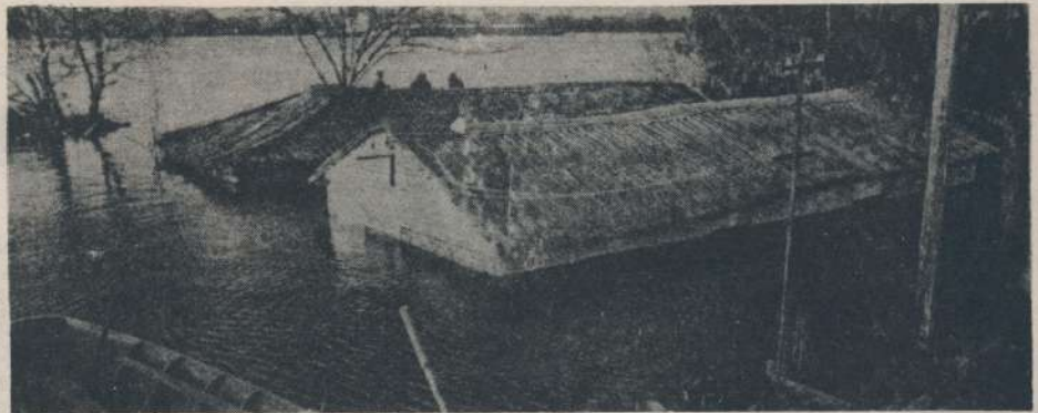
Con el agua al cuello, los litoraleños esperan infructuosamente la ayuda oficial y permanecen impotentes ante el desolador panorama.

Ante los embates que sufre el litoral argentino a causa de las inundaciones, y la escasa ayuda y la falta de decisiones oficiales, Federación Agraria Argentina hizo conocer por medio de una declaración pública, su posición y los reclamos a las autoridades, de medidas que tiendan a paliar la afligente situación de la población de esta parte de suelo argentino. Declaración que transcribimos textualmente: