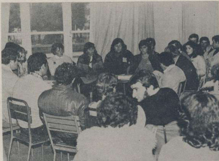
Jóvenes cooperativistas analizando sus problemas en una de las 4 comisiones de trabajo en que se dividió el evento.

Frente a los fracasos que se vayan presentando a lo largo del camino, los jóvenes proponen, buscar los motivos que lo ocasionan para no reiterarlos en el futuro, a la vez que considera importante preservar en la búsqueda de la ayuda, el apoyo moral y económico de la comunidad y la cooperativa.