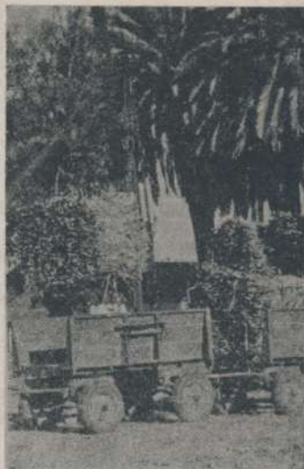
El productor recibe precios bajos y el consumidor paga precios altos, ni uno ni el otro especula, esto solo lo hace la intermediación.

Queda demostrada una vez más las maniobras especulativas que implementan los grandes capitales, lease oligarquía, para apropiarse del fruto del trabajo del productor y el trabajador, ya que por un lado paga precios irrisorios por la materia prima para la elaboración del producto que una vez acaparado en sus manos implementa, dentro del marco de la política de la oferta y demanda, libre juego de las empresas, etc., maniobras con el fin de encarecer el producto y de esta forma apropiarse del escaso sueldo que recibe el trabajador por su esfuerzo, contando con el guiño de sus amigos funcionarios, que les permite no sólo las maniobras sino también utilizar las estructuras del Esta-