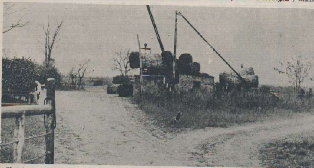
"Los sistemas de comercialización deben tener fijación de precios adecuados en todos los niveles", dice la declaración de principios del FAN del NOA.

28.- Estimular el afincamiento de auténticos productores en las zonas de fronteras, como el mejor instrumento de defensa de la soberanía nacional.