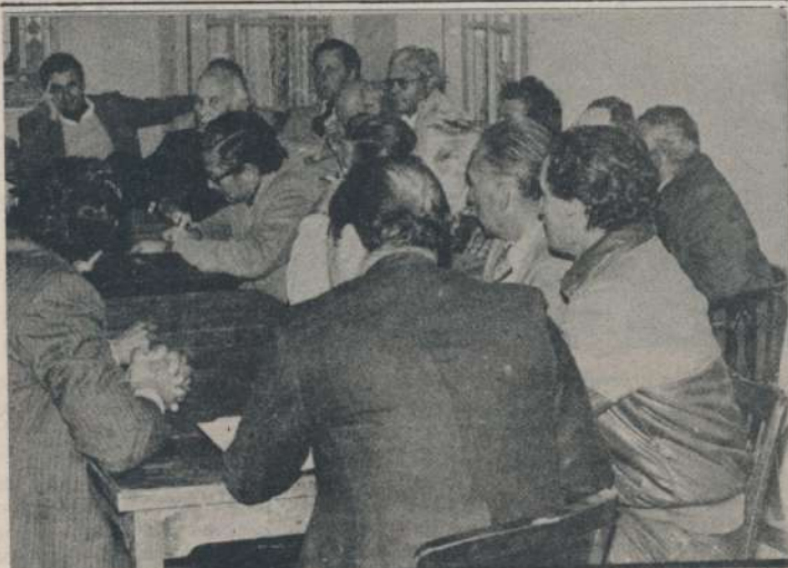
Aspectos de la reunión constitutiva del FAN que sostuvieron los dirigentes agrarios del noroeste, a fin de lograr la unidad de los productores.

El día 8 de julio del corriente año se realizó en Santiago del Estero, la reunión constitutiva del FAN, en esta región, que conto con las organizaciones de pequeños y medianos productores de las provincias de Jujuy, Salta, Tucumán, Catamarca y dueños de casa, además con la adhesión de CARPA (Cámara Agraria Riojana de Productores Auténticos) de La Rioja, y delegados de F.A.A. y promotores. Al término de la reunión, en conferencia de prensa se dió lectura y entrego a la prensa, la declaración, que a título de "primera propuesta" para la declaración de principios del FAN aprobó esta región. Por su importancia "CAMPO NUEVO" transcribe textualmente la misma.