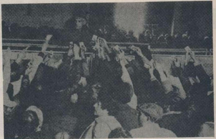
Aspecto que presentaba el puerto el día 30 de junio, a causa del paro dispuesto por los portuarios, en reclamo de mejoras.

Mientras ésto ocurría en las esferas allegadas al gobierno y por ende al poder, que no es, ni más ni menos, que la reversión del proceso político que estamos viviendo y que ahora exige investigación y condena a los que tanto daño han hecho a la patria. El pueblo en su lucha cotidiana para ir ocupando el espacio que le corresponde en la vida institucional del país, hace oír sus reclamos a través de las movilizaciones de los médicos, judiciales, los docentes, Editorial Córdoba, los choferes