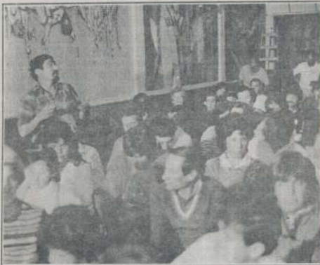
La asamblea general en pleno debate. Un martes 13 sin mala suerte y con mucha esperanza.

La Coordi es ya una organización con nombre y apellido. El martes 13 de noviembre, una emotiva asamblea general marcó el inicio de un nuevo camino. Sin titubear, los vecinos alzaron su brazo para elegir a los integrantes de la primera Comisión Directiva de la Coordinadora de Loteos Indexados y Barrios Carenciados de Córdoba. Y con ese voto, ratificaron la convicción de continuar la lucha por el derecho a la tierra asumiendo el desafío de marchar responsablemente por ese camino.