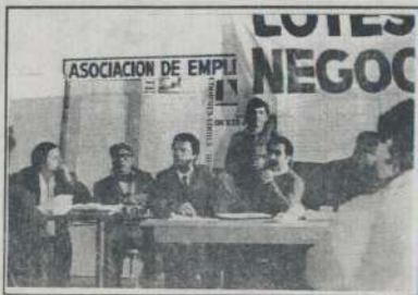
Se abrió el debate, la asamblea discute nuevas propuestas.

Los integrantes de la Coordinadora de Loteos Indexados y Barrios Carenciados de Córdoba nos reunimos en una asamblea general el martes 24 de julio para discutir sobre la mejor manera de defender nuestros derechos y solucionar así los problemas que nos aquejan. Cada barrio expuso a través de sus representantes los principales métodos de protesta y de difusión de nuestro conflicto y, en general, los doscientos participantes concluimos en que el plantón continúa siendo la mejor herramienta de la Coordi para seguir adelante en esta lucha por la tierra.