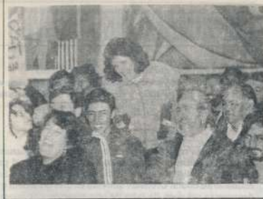
Mai que les pese a los vampiros, la gente de la Coordi no pierde su esperanza. Y menos aún, su sentido del humor.