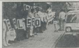
Las viejas luchas de la Coordinadora contra Salsadella