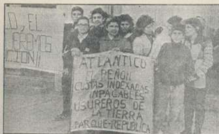
VECINOS DE MARQUEZ SOBREMONTE ANEXO BOSSY