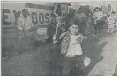
SANTA ISABEL Y PARQUE REPUBLICA DEMO

El equipo de prensa de EL INDEXADO y la Coordinadora toda, quieren expresar su apoyo a la lucha encarada y recordar que la efectividad de esta medida se asienta en dos pies fundamentales, la cantidad de vecinos que asisten y la continuidad que tienen los mismos. De no cumplirse estos requisitos, el esfuerzo de unos pocos y de vez en cuando, sólo servirá para demostrar a las inmobiliarias la debilidad en el reclamo que se está haciendo.