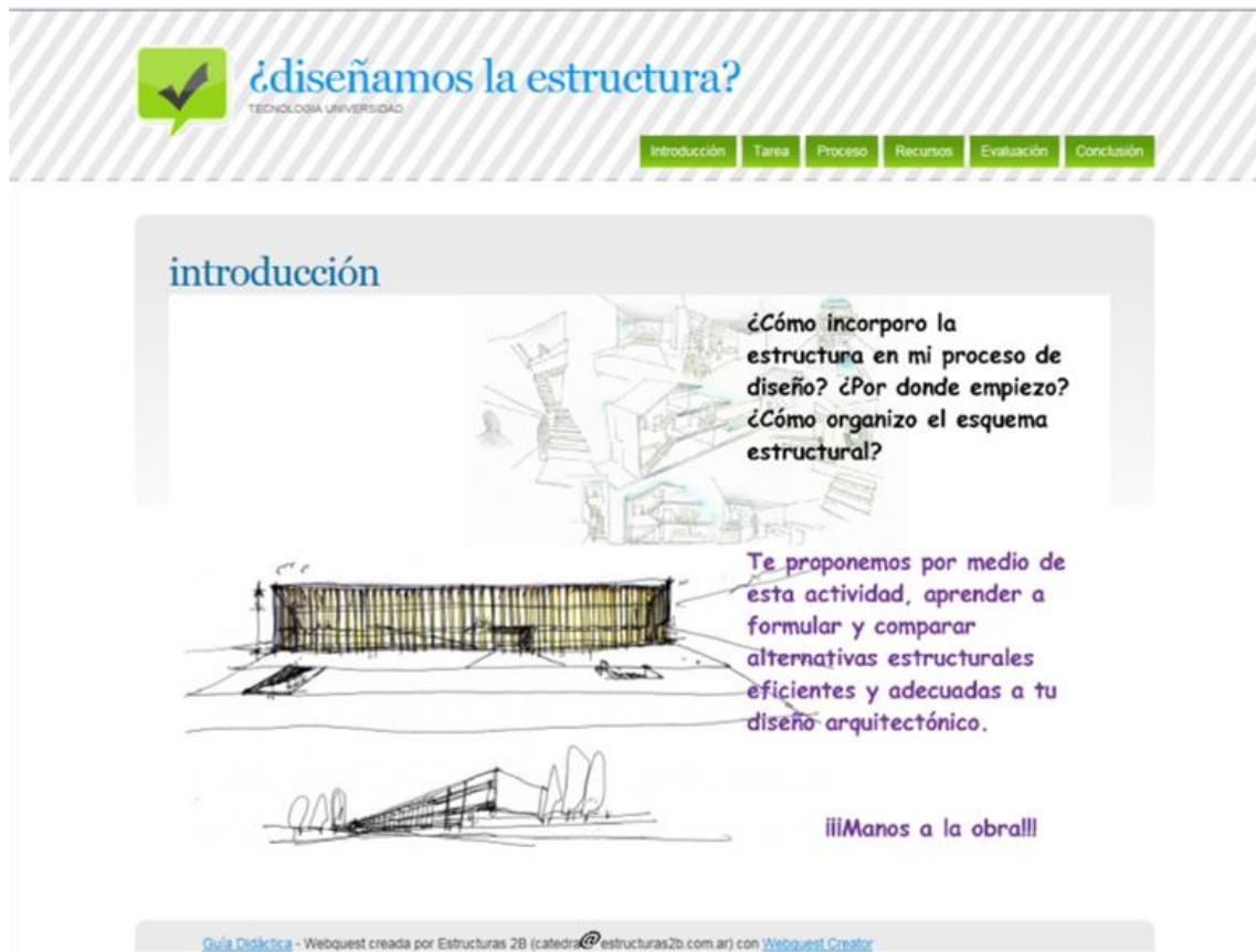
Figura 1. Introducción