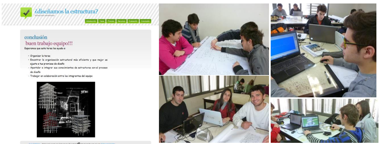
Figura 4. Conclusiones

6. Conclusiones: se resume la experiencia y estimula la reflexión acerca del proceso de trabajo con los fines de extender y generalizar lo aprendido (Figura 4).