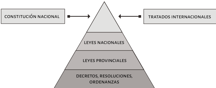
Figura 2. Estructura jerárquica del ordenamiento jurídico argentino

Nota: el gráfico representa la estructura jerárquica del ordenamiento jurídico que realiza Kelsen (2011), en cuya base se encuentran las normas de menor jerarquía y hacia la cúspide las de mayor, aplícale al ordenamiento argentino.