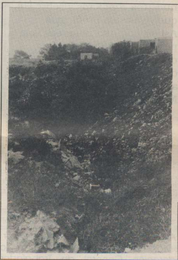
Aquí, con claridad, la barranca

Vemos que aquí se juntan una serie de hechos que hace especialmente notable la inescrupulosidad de los loteadores, con los cuales hay que tratar de terminar para evitar la estafa a la gente. Hay que unirse y luchar todos juntos, tener Fe y apoyar los movimientos de la Coordinadora de Loteos Indexados y Barrios Carenciados para realizar el sueño del techo propio.