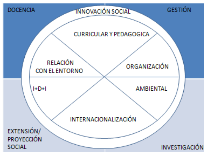
Figura n° 2: Dimensiones de la Innovación Social Universitaria Responsable

En esa misma publicación se proponen seis dimensiones de la innovación social universitaria, que son la expresión de los desafíos que enfrenta la universidad, y en donde se ven implicados los cuatro ámbitos de acción.