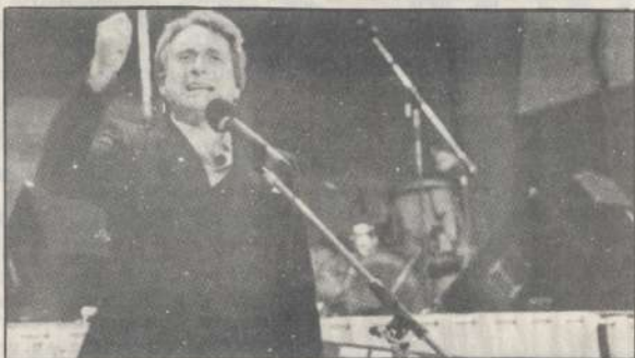
Raimundo Ongaro: otros tiempos.

Por estos días, pocos analistas políticos y sindicales han podido sustraerse a la tentación de establecer paralelos y comparaciones entre Saúl Ubal dini y Raimundo José Ongaro, el secretario general de la CGT de los Argentinos a fines de la década del sesenta y principios del setenta. Una tentación que, como es obvio, tendió a acentuarse ante los pronósticos de una eventual fractura en la cúspide de la central obrera. Pero se trata de dos hombres diferentes que vivieron en épocas muy distintas.