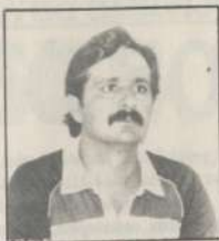
*Escribe Francisco Martínez Frances