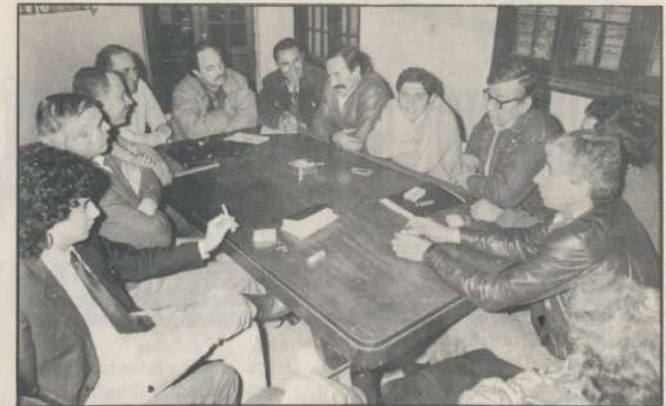
Consejo Directivo G.C.T. Río Cuarto

Este desolador panorama ha tendido a detenerse durante agosto, confiando la dirigencia sindical en que a corto plazo comenzarán a verse algunos signos de reactivación, sobre todo, si la palanca de la "Revolución Productiva" que pregonó Carlos Me-