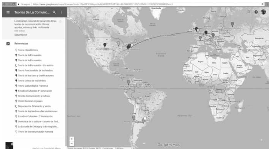
Figura 2. Mapa interactivo de presentación de las Teorías, Modelos y Debates relevantes del Campo de la Comunicación Social