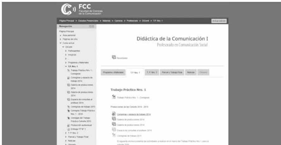
Figura 1. Pautas de Trabajo y organización del recorrido presentado en aula virtual.

repositorio de archivos sonoros en el cual fueron cargadas las producciones de micro-programas de radio (Figura 4). Debido a actualizaciones de las plataformas, se ha perdido acceso a las producciones de líneas de tiempo interactivas.