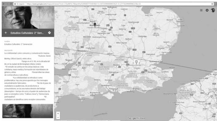
Figura 3. Un ejemplo de las propuestas recogidas en el Mapa interactivo de presentación de las Teorías, Modelos y Debates relevantes del Campo de la Comunicación Social.