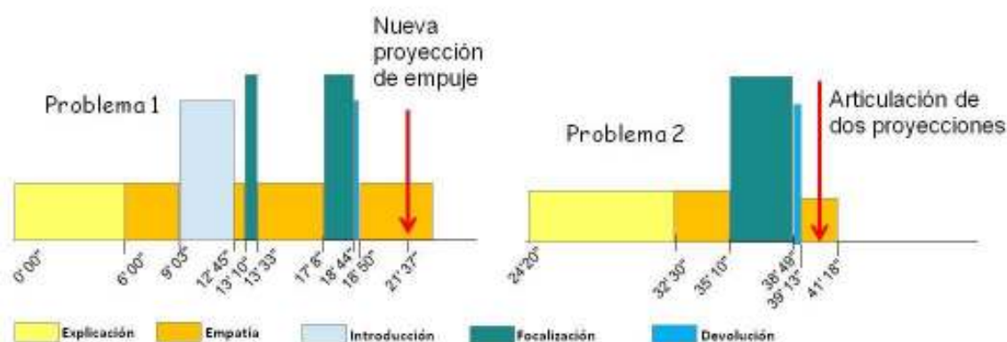
Figura 2: Los ciclos de perturbación