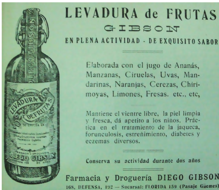
Figura 1: Levadura de frutas Gibson

consideraba en mi estudio y a partir de qué criterio los había escogido. Semejante alarma me puso manos a la obra: tracé una tabla (que se tornó cada vez más extensa) donde especificué el año de publicación y nombre de la revista –junto con otras informaciones editoriales que pudiesen ser de utilidad–, la denominación del producto que se ofertaba, para qué tipo de enfermedad estaba destinado y cuál era su origen (en términos nacionales). La selección se realizó a partir de esos elementos: las publicidades debían contener la mayor parte de esos datos. Además de estas particularidades, también me dispuse a trabajar con fuentes que mostraran ciertas tendencias en el uso de imágenes, ilustraciones, logos u otras formas de destacar los medicamentos o insumos médicos que se promocionaban (ver figuras 1 y 2).