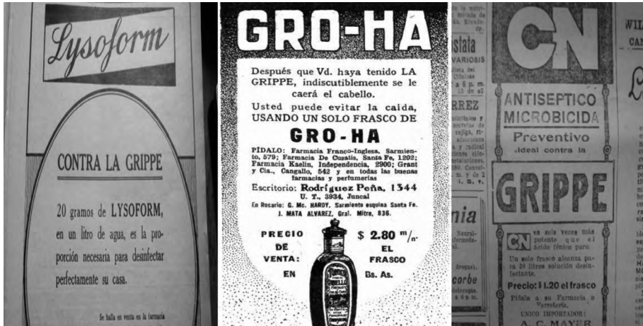
Fuentes: Caras y Caretas (26 de octubre de 1918 y 9 de noviembre de 1918); La Nación (23 de octubre de 1918).

En esta búsqueda en medios gráficos sobre publicidades, comencé también a encontrarme con las muchas imágenes caricaturescas que mencionaban a la gripe española. Para investigar esa problemática, partí de entender a estas caricaturas como de consumo masivo, en especial en la ciudad de Buenos Aires, donde la revista Caras y Caretas tenía mayor circulación. En términos de la metodología, traté de analizar heurísticamente la imagen: era necesario entenderla como un documento al cual debíamos estudiar con sus silencios y sus discursos. Las imágenes representaban en su conjunto cierta ambigüedad, en el sentido que la gravedad de la enfermedad estaba en relación con cierta virtualidad, ya que eran el Estado y los medios de comunicación los que habrían generado cierto temor a la dolencia, que no llegaba a sociedad en su conjunto. Esto se podía apreciar en una caricatura en particular, a partir de una frase: la epidemia de moda o el pánico de la gripe 6 .