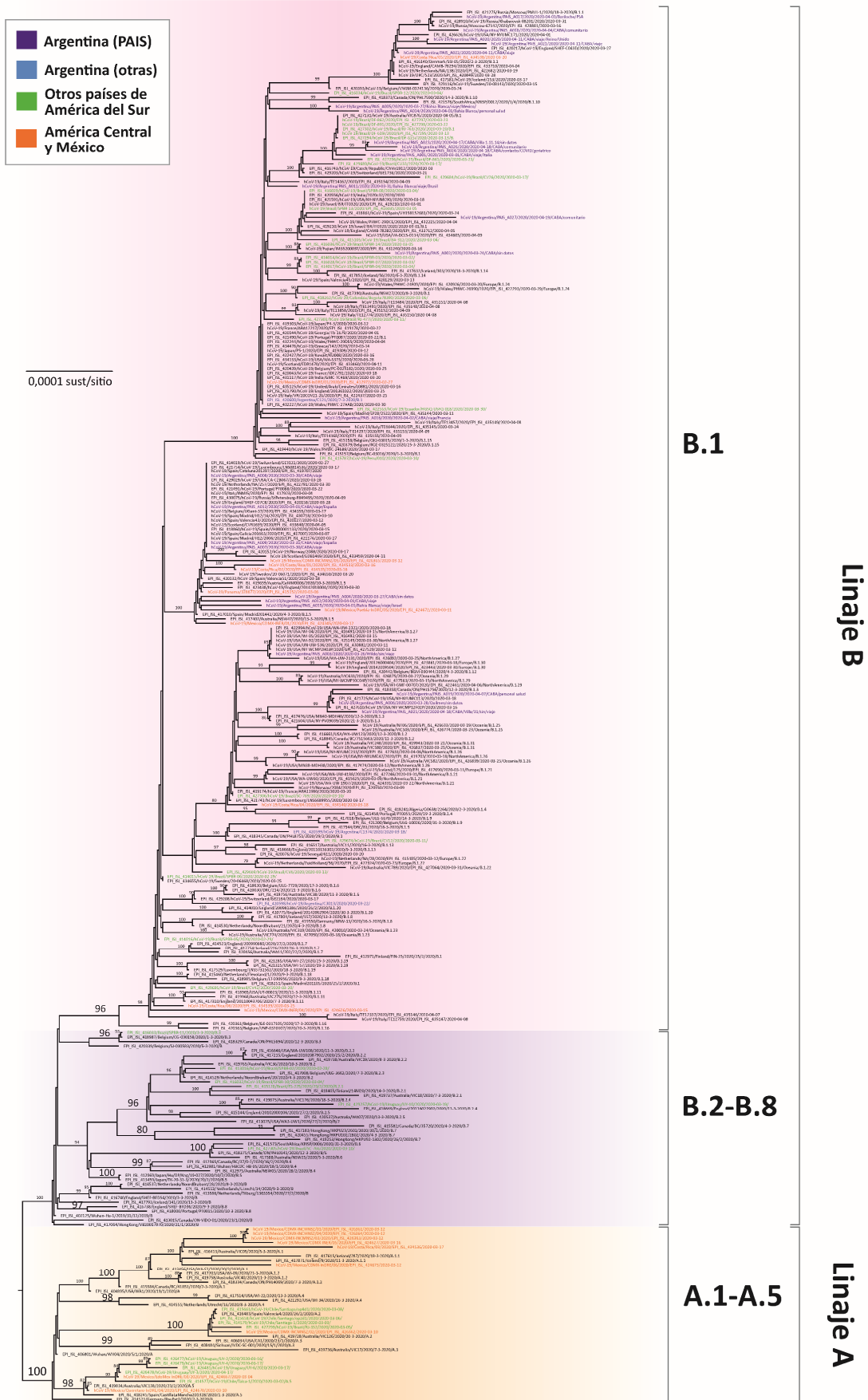
Figura 1. Árbol filogenético de SARS-CoV-2 (el subárbol del linaje B.1 se encuentra ampliado en la Figura 2).