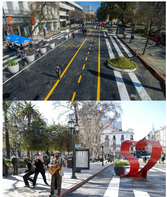
Figuras 3 y 4. Intervenciones realizadas en la calle San Jerónimo para la supermanzana de la Plaza San Martín.

En las intervenciones llevadas a cabo en las tres supermanzanas, se pintaron las calles bajo los principios del urbanismo táctico (pero sin la participación ni el involucramiento de la ciudadanía, quien se encontró con las propuestas ya desarrolladas); se dispusieron sendas peatonales delimitadas; se establecieron sectores de espacios públicos que fueron cedidos al espacio privado de comercios, restaurantes y sedes bancarias; se delimitaron espacios para bicicletas y se crearon cancheros que tienen como intención la generación de una escena que contenga mayor