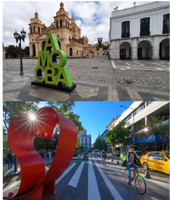
Figuras 9 y 10. Artefactos estéticos frente al edificio de la Iglesia Catedral.

utilización de la cultura identitaria del cuarteto como recurso (Yúdice, 2002), al que se le asigna un valor mercante para ser consumido e intercambiado.