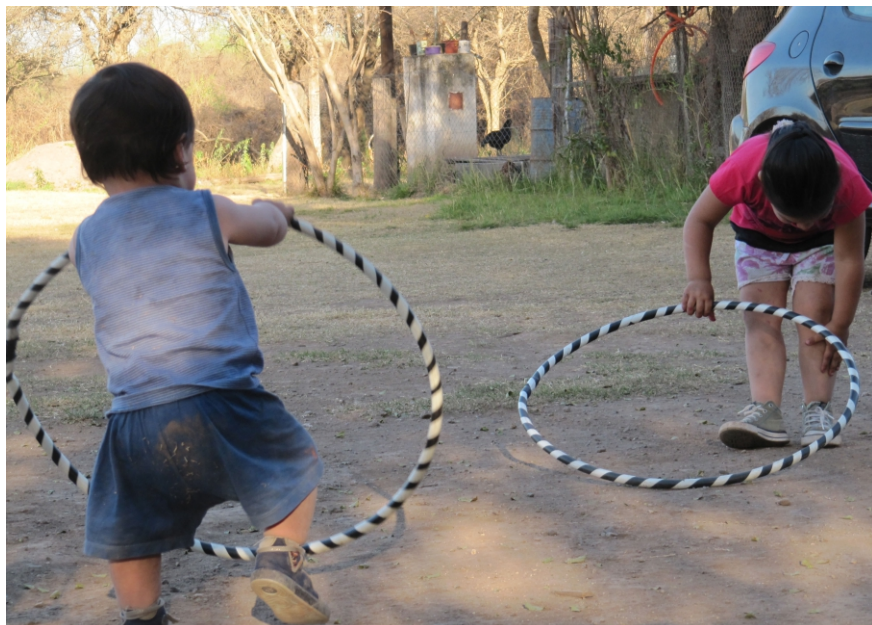
Figura 3. Infancias, confinamiento y aislamiento por Covid - 19. Fuente, imagen de la autora