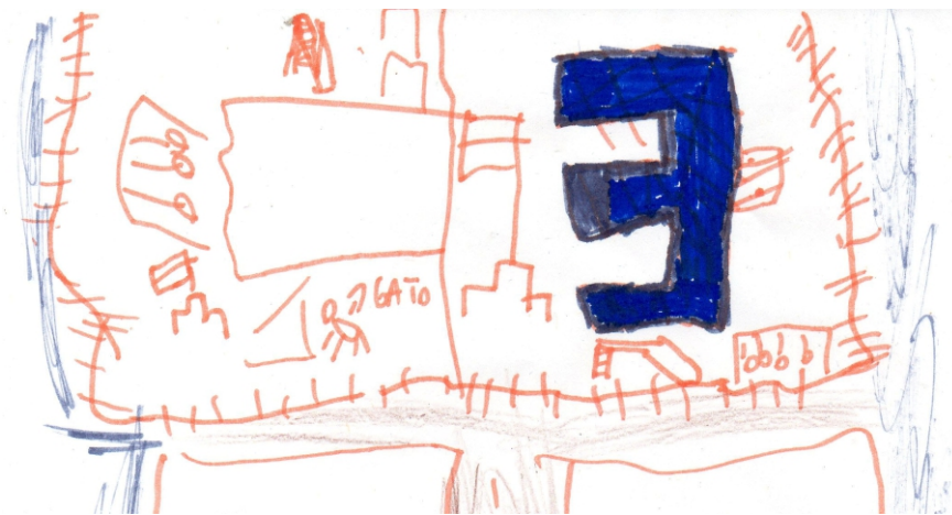
Figura 6. Infancias, confinamiento y aislamiento por Covid - 19. Fuente, imagen de la autora

Las escuelas públicas se merecen este repensar para el ser y hacer y quizá retomar algunas ideas de