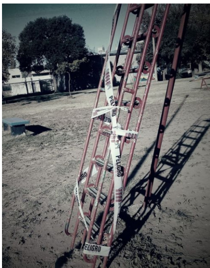
Figura 1. Infancias, confinamiento y aislamiento por Covid - 19. Fuente, imagen de la autora

El confinamiento ha restringido todo este habitar. El tiempo para hacer esto o aquello. La prohibición de lugares y la imposibilidad de los encuentros. Por ejemplo, una situación impactante es que se han encontrado con cintas de peligro que envuelven sus mobiliarios lúdicos.