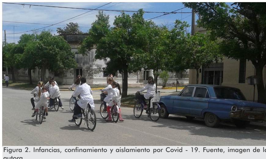
Figura 2. Infancias, confinamiento y aislamiento por Covid - 19. Fuente, imagen de la autora

Cabe destacar, en este contexto y para todas las personas, que el uso