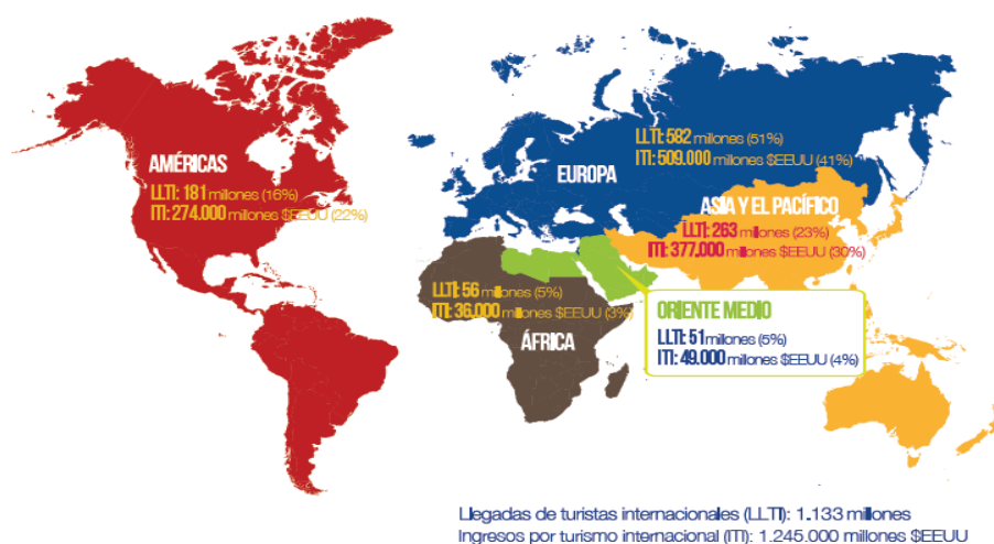
Figura 1: Ingresos y Llegadas del Turismo Internacional, 2014