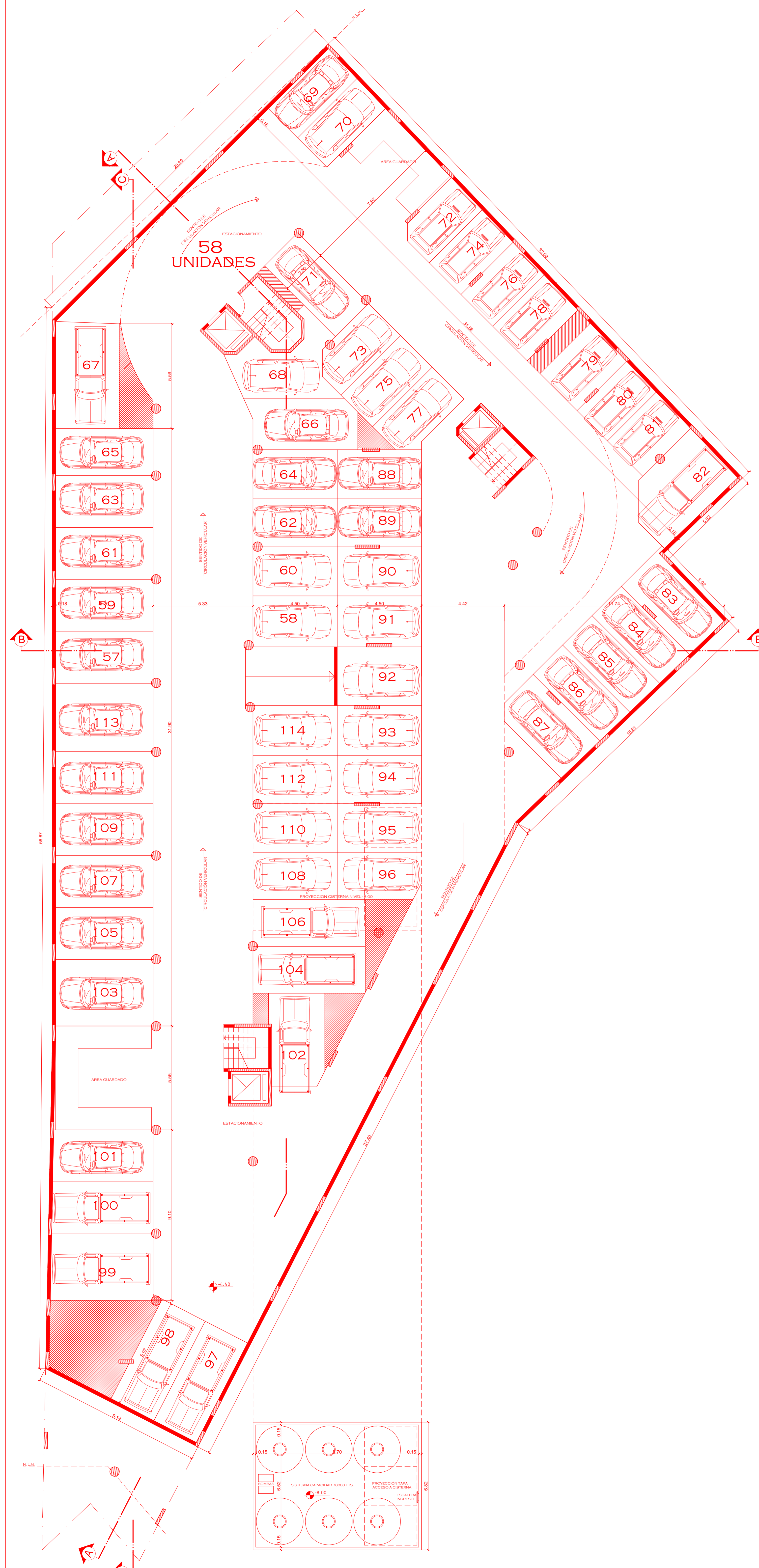
PLANTA 2º SUB-SUELO ESC. 1:100