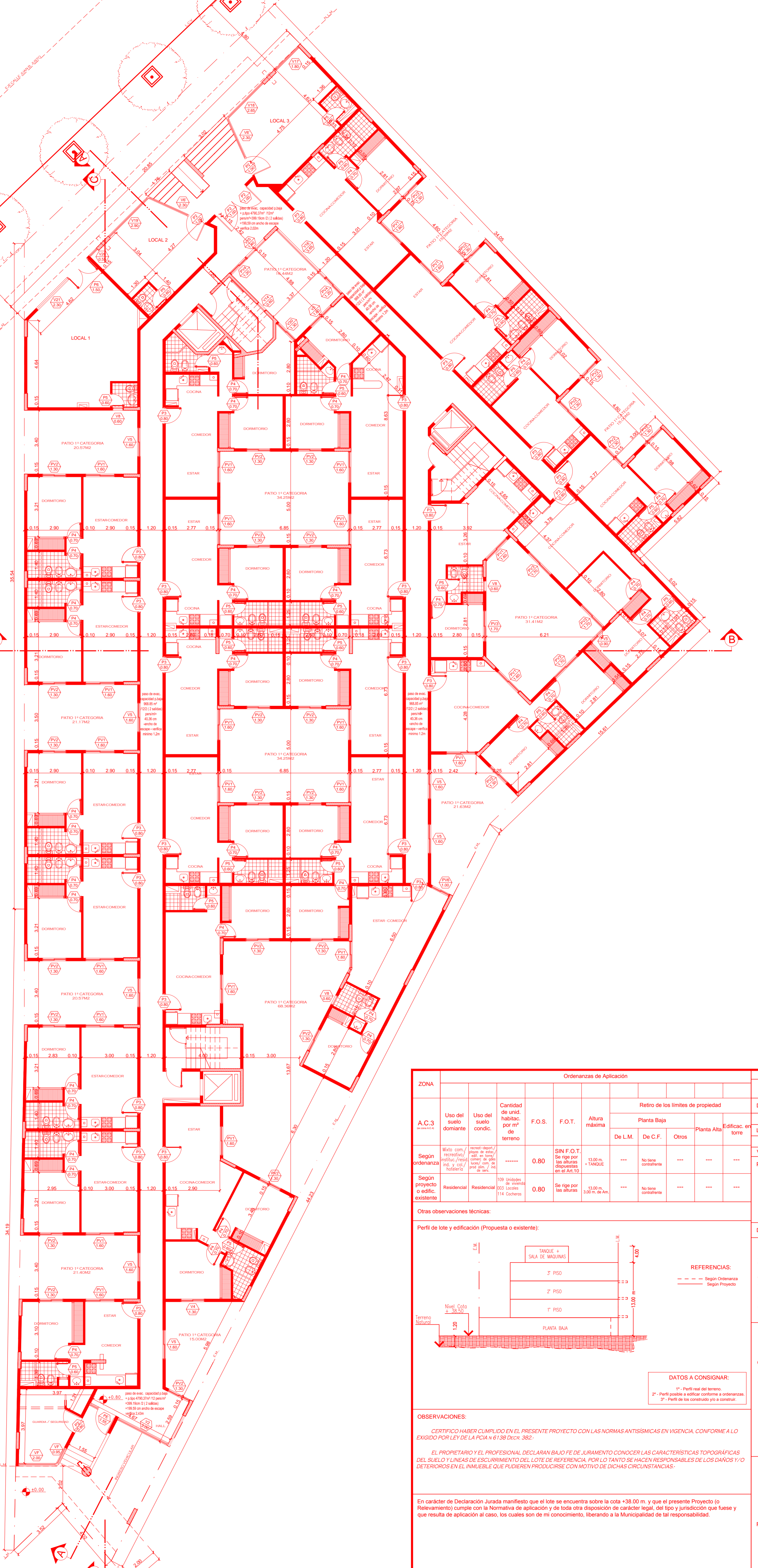
PLANTA BAJA ESC. 1:100