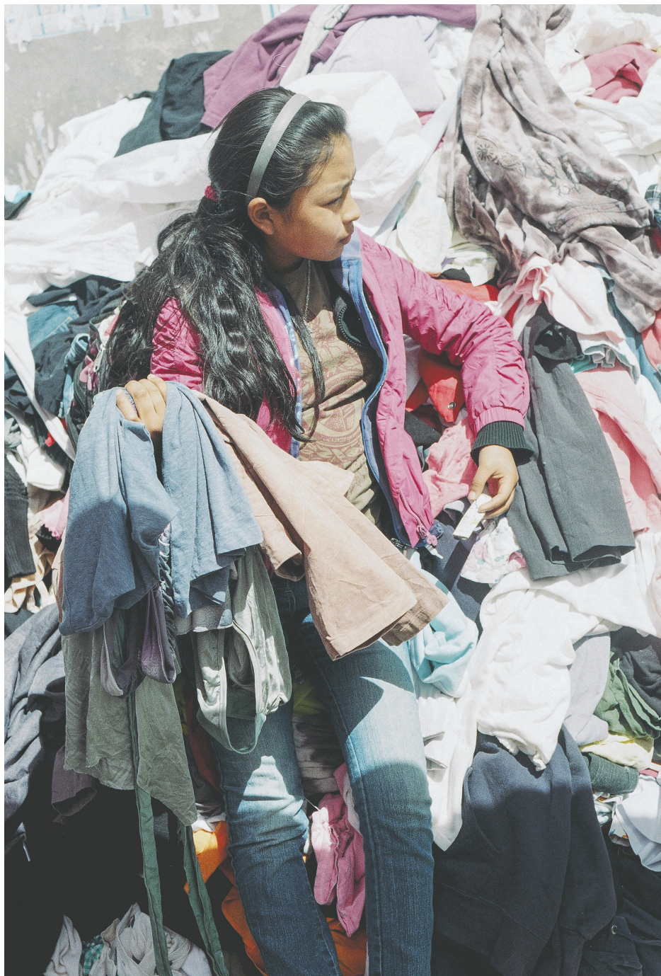
Figura 2. Niña vendedora de Ropa Usada Feria 16 de Julio / El Alto, La Paz, Bolivia.