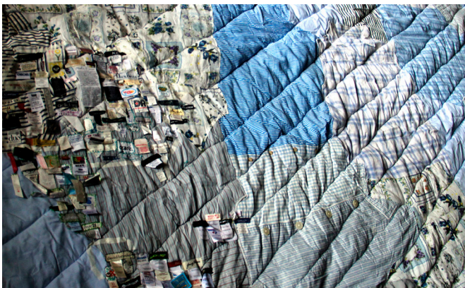
Figura 18. Detalle de la “Manta Mundi”

Pienso esta manta como un work in progress , intentando cubrir-la cada vez más.