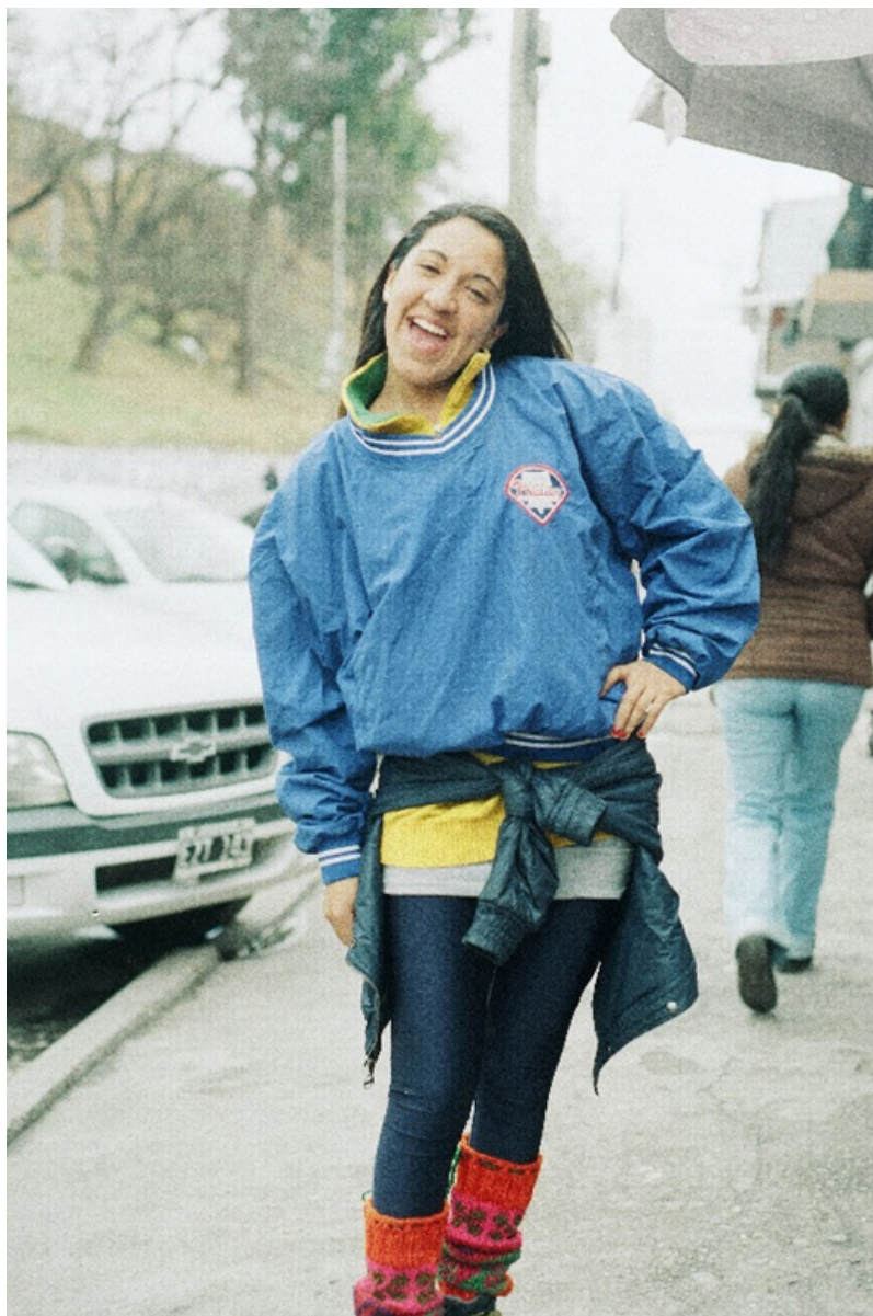
Figura 8, Corista de la banda "Tributo Azul"

la capital jujeña sin problemas. Le vendimos unas prendas a la corista de la banda, nuestra primer clienta (figura 8).