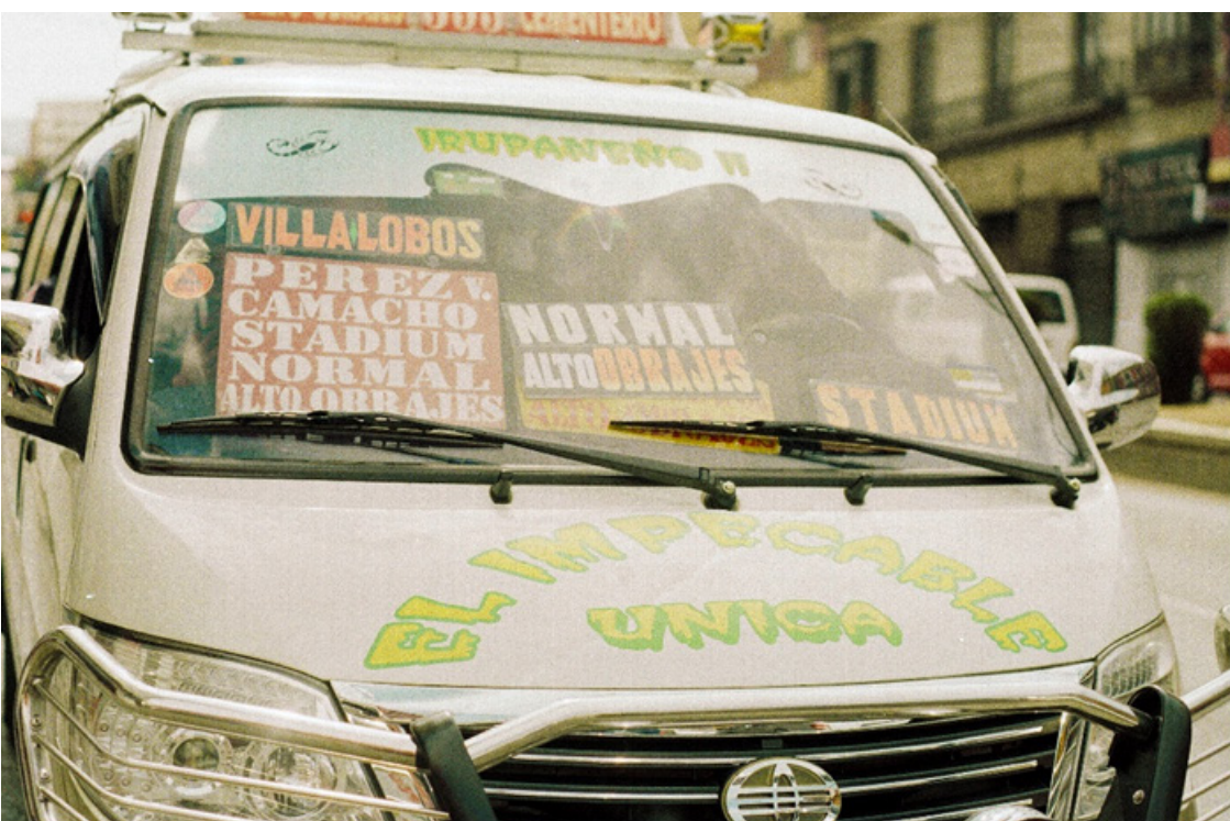
Figura 10 - "Trufi", La Paz - Bolivia