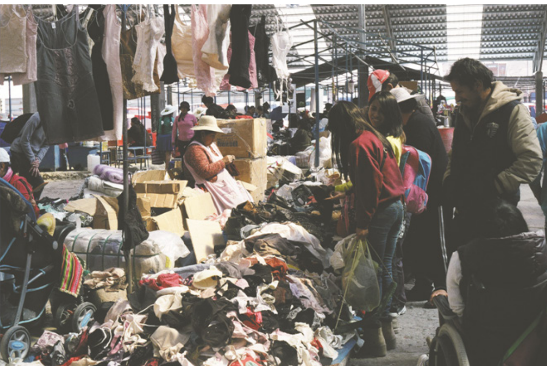
Figura 12. Feria de Kantuta, Oruro, Bolivia