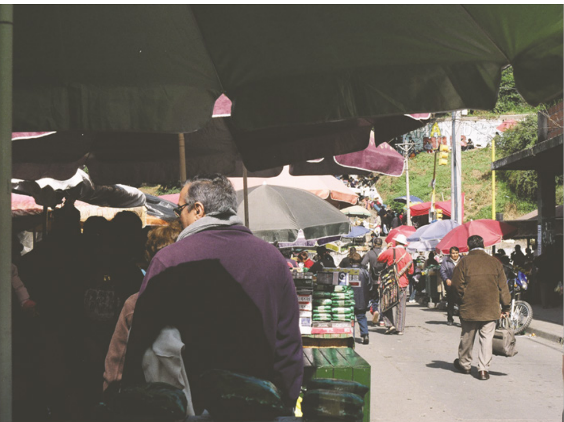
Figura 1, Feria "Terminal Vieja", San Salvador de Jujuy.