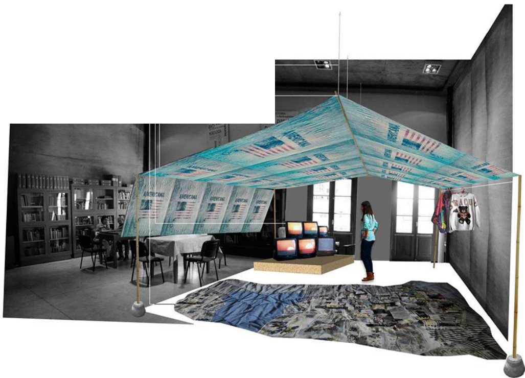
Figura 13. Fotomontaje de la Instalación