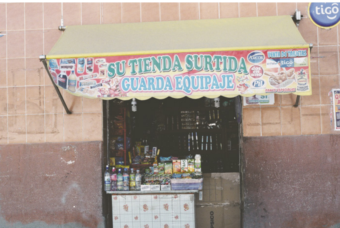
Figura 4. Guarda equipajes. Oruro, Bolivia