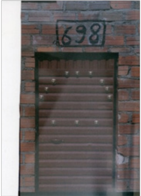
Fragmento del Fanzine (dos pág.)