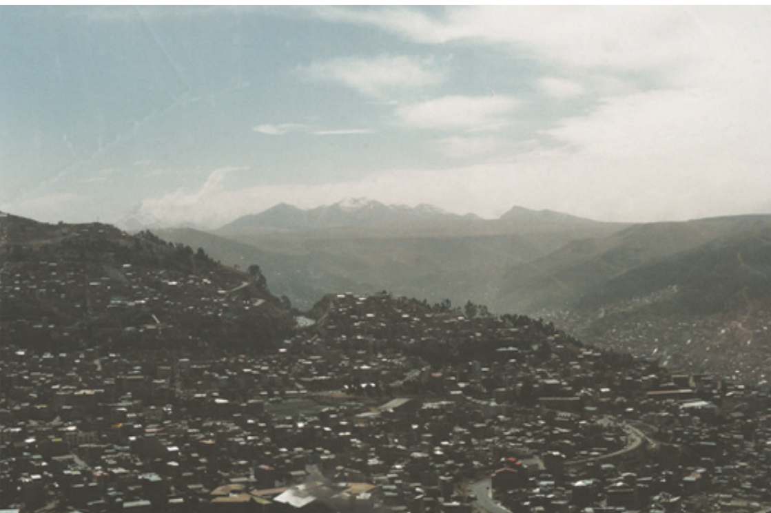
Figura 6. "La olla" La Paz, Bolivia.