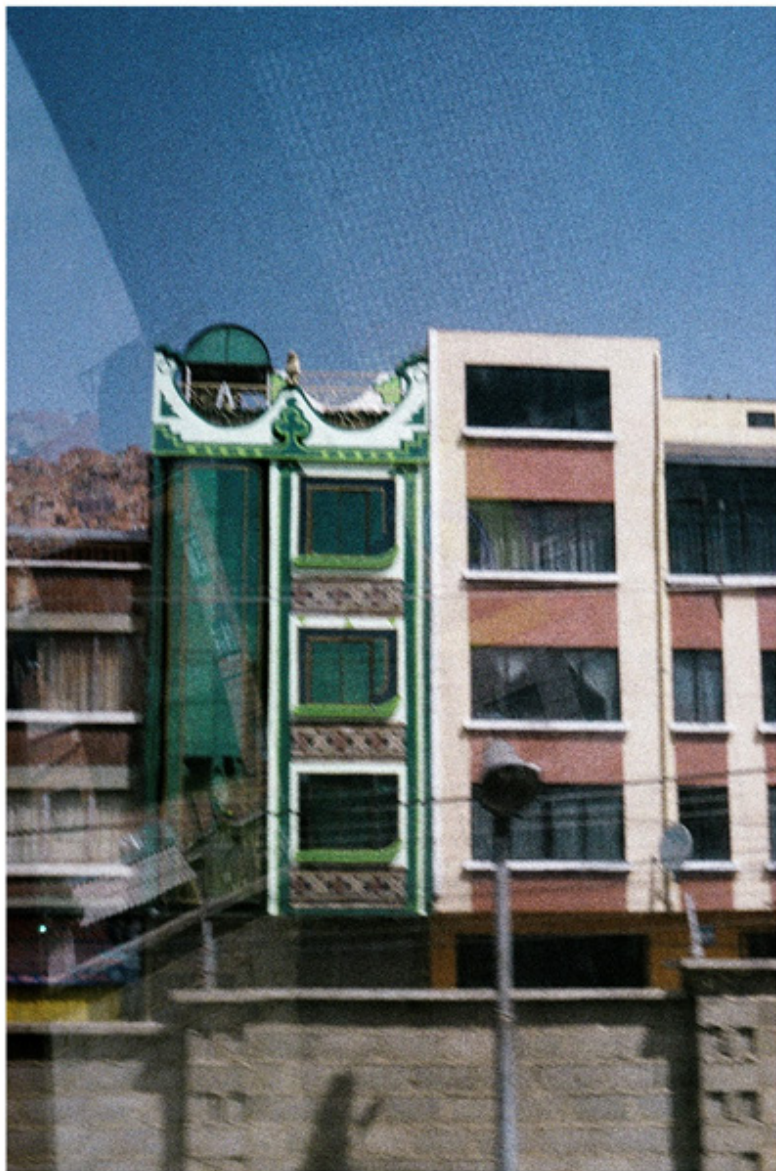
Figura 9. "Cholets" o Arquitectura Chola. La Paz - Bolivia.