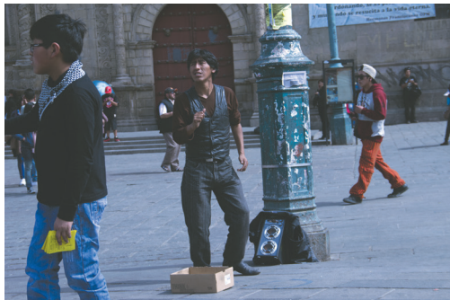
Figura 14, 15, 16 y 17. Fotogramas de Videos