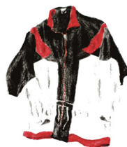
Figura 19. Dibujos de prendas