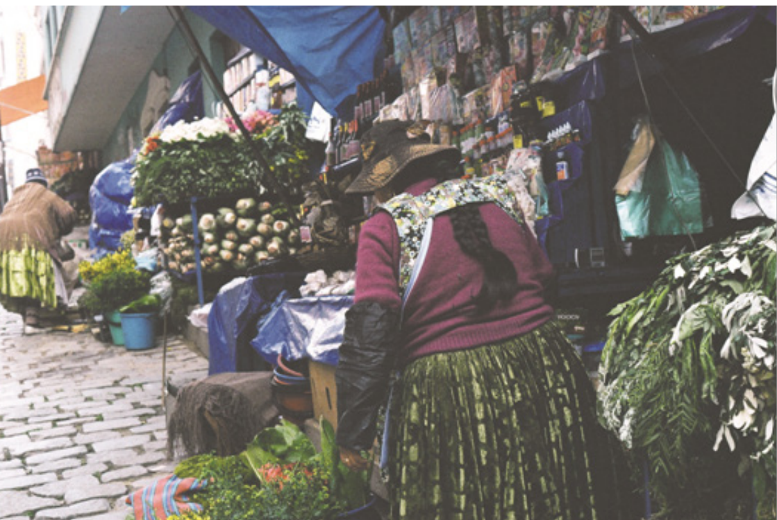
Figura 5. Mercado de la Brujas, La Paz, Bolivia.