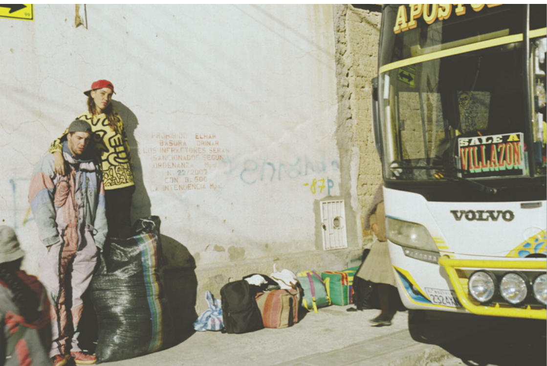
Figura 7. Mi socio y yo. Villazón, Bolivia.