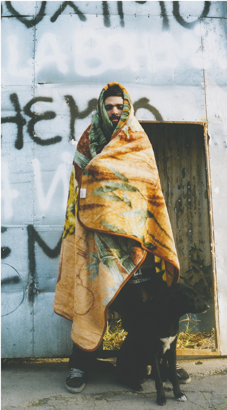
Figura 20. Foto del Catálogo o Libro de viaje