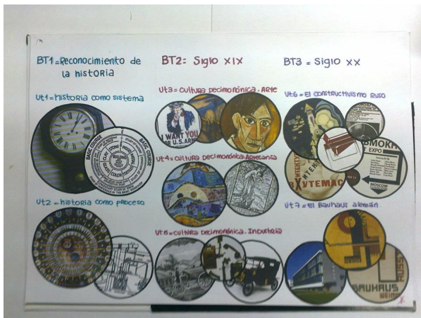
Gráfico conceptual del Programa de la Materia

En las prácticas del año, en los siguientes dos trimestres, el alumno aborda con la misma metodología los otros dos bloques temáticos de la cultura material del siglo XIX y de las primeras tres décadas del siglo XX. Allí analiza antecedentes de objetos industriales y artesanales del siglo XIX y posteriormente, objetos de diseño de las escuelas alemana (Bauhaus) y rusa (Vkhutemas) en su contexto.