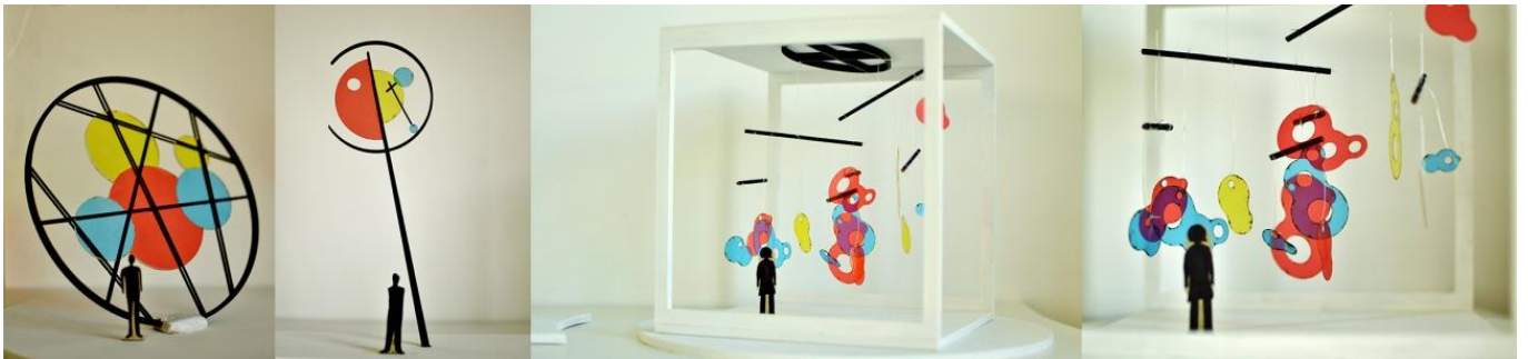
Trabajo de los alumnos Basso, Paulina, Bustelo, Ezequiel y Suby, Agustín. Morfología 3. 2017