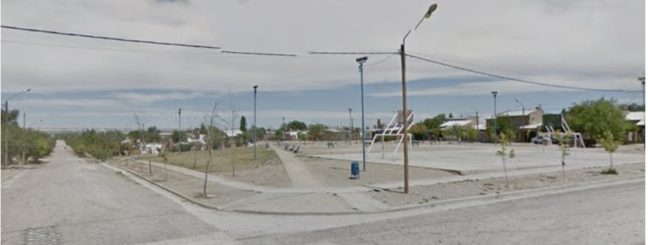
Imagen. Captura propia desde google Street view.

Esta es la plaza de B° Nuevo, tiene algún equipamiento urbano y está en medianas condiciones de mantenimiento, el problema es que es la única para una población de aproximadamente 20000 habitantes.