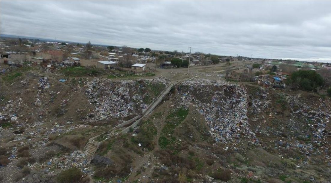
Imagen. La Súper Digital

El resto de los espacios verdes del barrio son residuales, sin tratamiento e incluso algunos representan serios riesgos para la salud y seguridad de los habitantes como el zanjón de calle defensa.