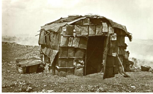
Barrio La Rana, año 1901

Imagen izquierda: producción propia, año 2016. Barrio Costa del lago. Calle Eva Perón y Laguna del Libertador Imagen derecha: "Habitación particular en la quema de basura". Foto de Harry Grant Olds, 1901. (Tomada del libro: Buenos Aires 1910: memoria del porvenir ; Bs As., 1999).