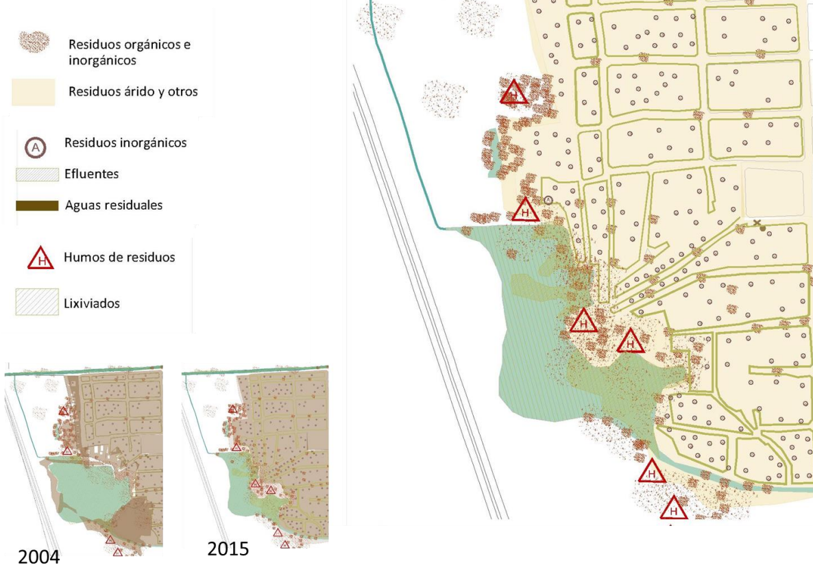
Mapa del barrio Costa del Lago

Los residuos son materiales que han sido utilizados en un proceso productivo o de consumo y han sido desechados por ser considerados inútiles.