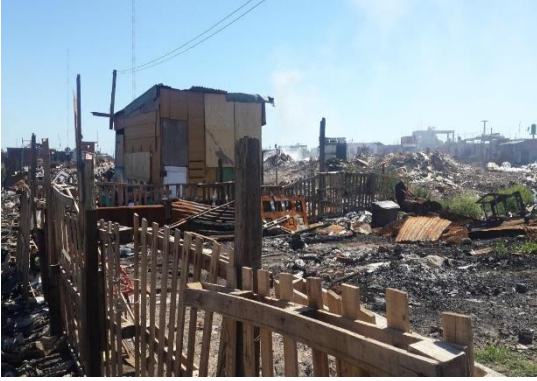
Barrio Costa del Lago, año 2016