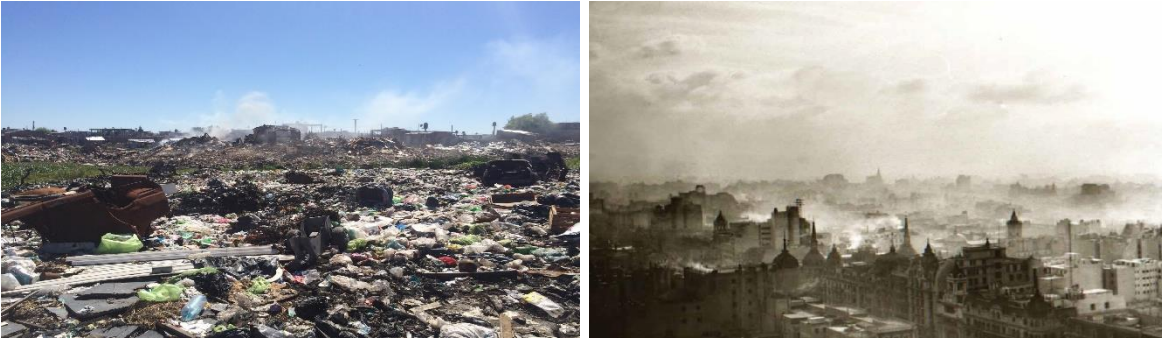
Imagen izquierda: producción propia, año 2016. Barrio Costa del lago. Calle Eva Perón y Laguna del Libertador

“Este método simplificó el sistema de gestión, pero al mismo tiempo invadió la ciudad de hollín y gases emanados de la combustión de residuos que ensuciaban ciudad y contaminaban el aire con la producción de altos volúmenes de dióxido de carbono y otras partículas contaminantes.” (F Suarez 1998)