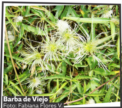
Barba de Viejo