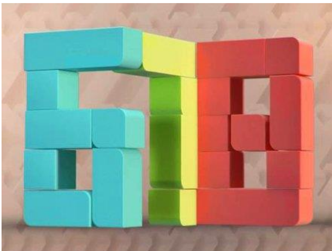
Logotipo tradicional del programa televisivo "6, 7, 8".