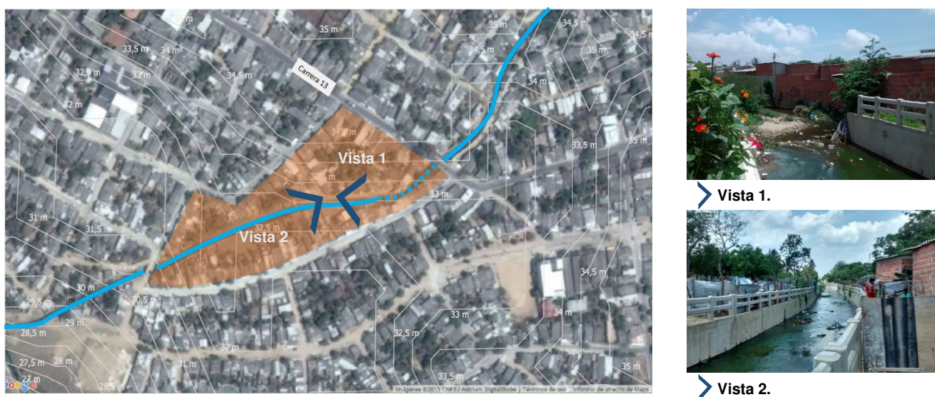
Gráfica 6. Sistema de drenaje en el caso de estudio. Elaboración propia.

Según Ka'zmierczak & Cavan, una característica física determinante en el incremento de la vulnerabilidad es el manejo inseguro e inadecuado de las escorrentías en la solución urbanística del asentamiento (2011) y en la medida estructural para mitigar el riesgo (Mustafa. 2009). La poca efectividad en el desagüe del terreno expone a la comunidad ante inundaciones.