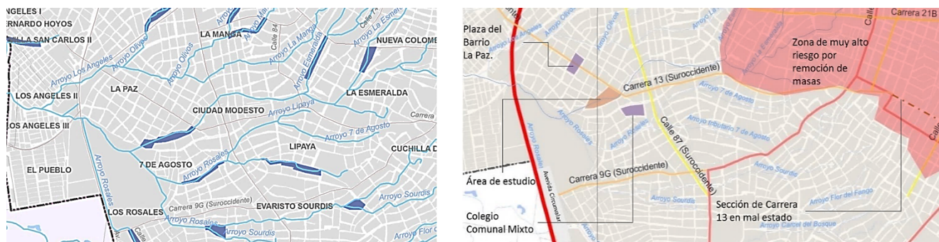
Gráfica 4. Localización y referencias del caso de estudio en el Sector. Elaboración propia con base en Plan de Ordenamiento Territorial, planos U-11 y U12.

La metodología requirió del análisis en un caso de estudio de las características encontradas inicialmente, este se localizó en las manzanas con nivel de amenaza alta de inundación (1.5 y 3.0 m de altura) del arroyo la Esmeralda del barrio Ciudad Modesto (Ver gráfica 4). El área delimitada en el plano U-11 “Amenazas de Inundación” del Plan de Ordenamiento Territorial, corresponde a una zona principalmente residencial con estratificación socioeconómica baja. El arroyo pertenece a la cuenca Occidental enmarcada por la ladera del mismo nombre, catalogado como arroyo menor dentro de una red de afluentes y arroyos que desaguan en el arroyo León (arroyo mayor), la Ciénaga de Mallorquín hasta llegar al Mar Caribe. Aun sin ser un caso representativo del sector, pues en el suroccidente las quince áreas reconocidas con amenaza de inundación presentan el mismo nivel, es un caso con características propias correspondientes con el interés de la investigación como una trama urbana discontinua, un sistema de drenaje no resuelto y diferentes patrones de implantación o localización de la vivienda en la fuente de riesgo; todas ellas acorde con el origen del asentamiento.