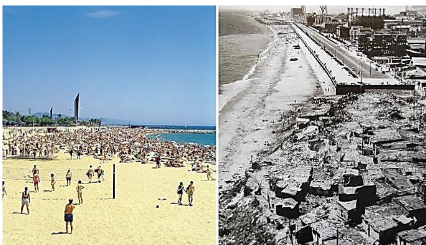
Figura 02 – Depois/Antes da revitalização na Orla Marítima de Barcelona/ES

Quanto ao mar, Barcelona/ES restabeleceu, redescobriu e apoderou-se do seu bem, uma vez que era uma cidade que possuía mar e não o usufruía. Assim, com o advento dos Jogos Olímpicos a cidade transformou totalmente a orla marítima (IGLESIAS, 2010). Em 1987, com a edificação de um novo porto, que seria o meio de transação entre a antiga cidade, já se iniciava uma prática de interferência na orla marítima que unificaria a cidade ao mar. Tais projetos visavam tanto modificações de proporção intermediária, como aquelas de maior competência. Sendo que tais intercessões de pequena escala seriam para reavivar a relação de Barcelona/ES com o mar (ZAPATEL, 2011). Com isso, desde o advento dos jogos olímpicos a orla marítima passou a ser uma das principais atrações de Barcelona, a qual possui inacabáveis calçadas que abrangem todo o litoral, com vastas praias que foram reconquistadas. Entretanto, não foi apenas as praias que se sobressaíram, o porto se constituiu como um centro esportivo e de lazer, com ancoradouros, bares, shoppings, restaurantes e principalmente, como uma nova área turística (IGLESIAS, 2010) (Figura 02).