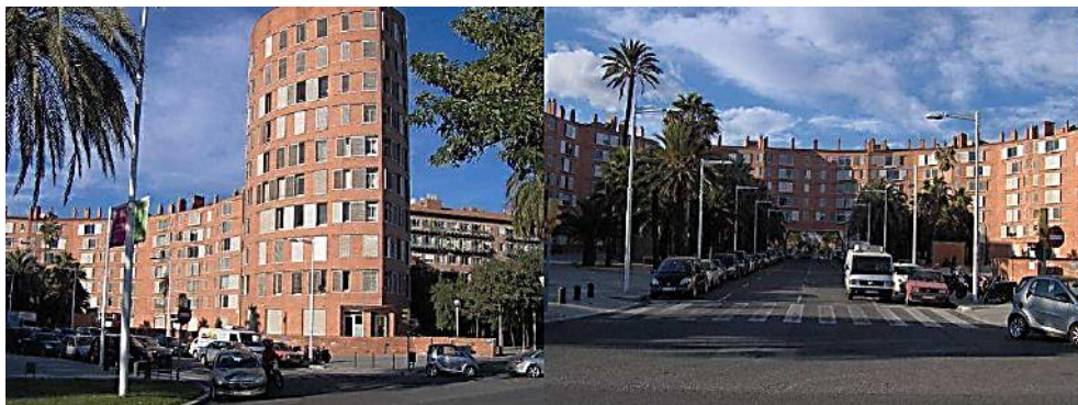
Figura 03 – Vila Olímpica

revitalização em toda a extensão da orla marítima da cidade. Entretanto, a Vila Olímpica concebida, após ser utilizada por um mês (tempo de duração das Olimpíadas), se tornou um bairro pertencente à cidade em janeiro de 1993, esse detém um setor residencial de categoria, com centralização de atividades e serviços, amplos espaços públicos e facilidade de acesso e mobilidade, favorecendo a região com investimentos, consumidores e usuários, não permitindo que ela se submergisse (FERNANDES, 2006).