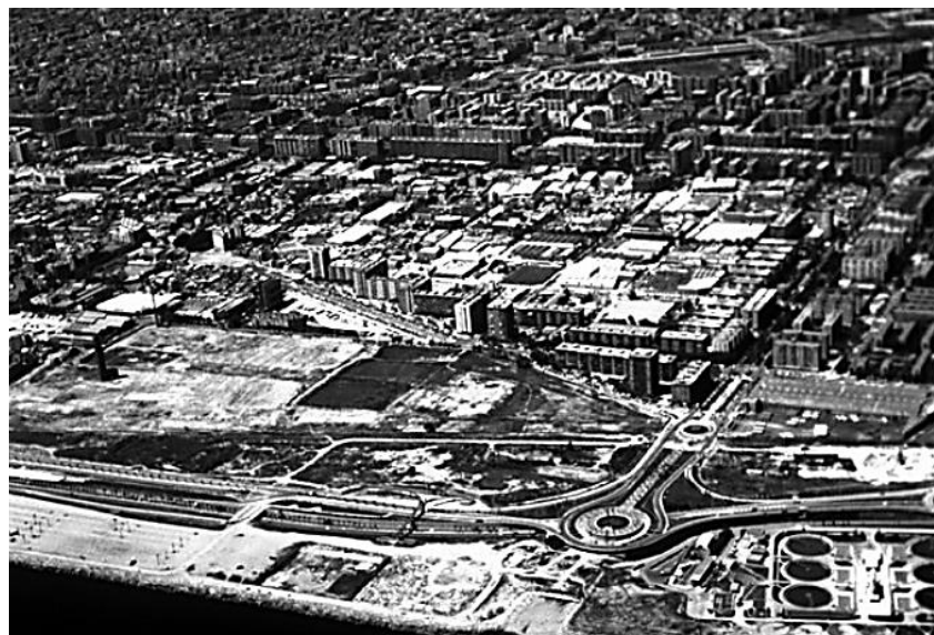
Figura 01 – Estrutura viária Barcelona/ES

Quanto ao mar, Barcelona/ES restabeleceu, redescobriu e apoderou-se do seu bem, uma vez que era uma cidade que possuía mar e não o usufruía. Assim, com o advento dos Jogos Olímpicos a cidade transformou totalmente a orla marítima (IGLESIAS, 2010). Em 1987, com a edificação de um novo porto, que seria o meio de transação entre a antiga cidade, já se iniciava uma prática de interferência na orla marítima que unificaria a cidade ao mar. Tais projetos visavam tanto modificações de proporção intermediária, como aquelas de maior competência. Sendo que tais intercessões de pequena escala seriam para reavivar a relação de Barcelona/ES com o mar (ZAPATEL, 2011). Com isso, desde o advento dos jogos olímpicos a orla marítima passou a ser uma das principais atrações de Barcelona, a qual possui inacabáveis calçadas que abrangem todo o litoral, com vastas praias que foram reconquistadas. Entretanto, não foi apenas as praias que se sobressaíram, o porto se constituiu como um centro esportivo e de lazer, com ancoradouros, bares, shoppings, restaurantes e principalmente, como uma nova área turística (IGLESIAS, 2010) (Figura 02).