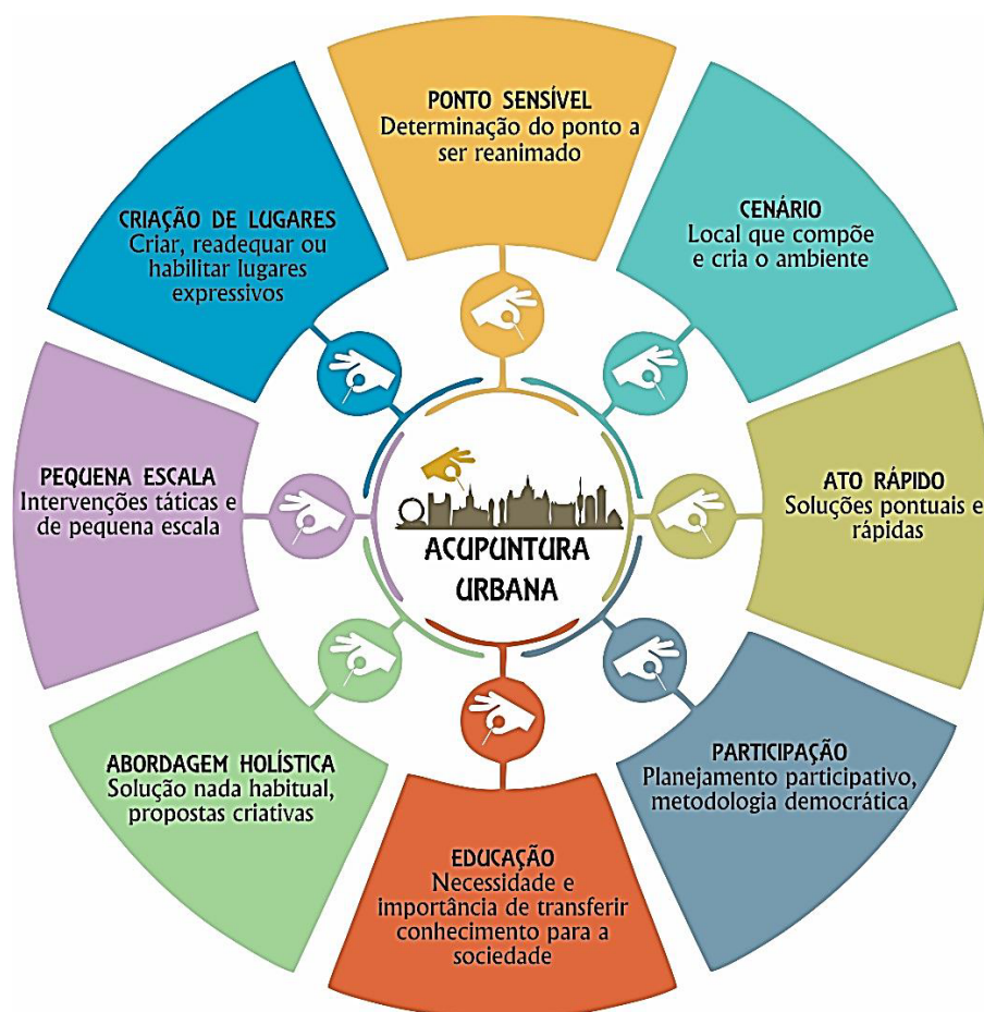
Fluxograma 01 - Fluxograma Princípios da Acupuntura Urbana

De tal modo, adotando o proposto por Hoogduyn (2014), faz-se uma descrição dos respectivos princípios: