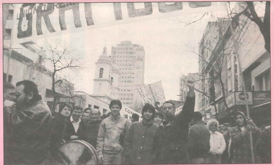
La Unión Obrera Gráfica en el paro del 10 de Agosto

Frente al próximo paro con movilización decretado por la C.G.T.