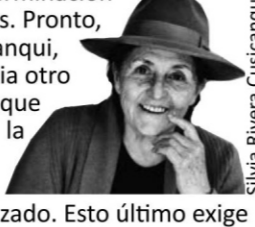
Silvia Rivera Cusicanqui

• ¿Cuáles considerarás son los temas- problemas prioritarios en la agenda local latinoamericana? - Identificamos que los temas-problemas prioritarios en la agenda local latinoamericana son aquellos ligados a la sostenibilidad de las acciones. Si bien se trata de un asunto global hay cuestiones más urgentes en nuestros territorios. En el marco de la crisis ecológica reconocemos, a grandes rasgos, dos abordajes teóricos y prácticas diferentes aunque puedan ser complementarias. Por un lado, aquellas que se concentran alrededor del peligro que corre el ambiente y su impacto directo en la supervivencia humana a corto plazo y, por otro, aquellas preocupadas por sectores sociales en peligro inminente de supervivencia debido a la insatisfacción de las necesidades básicas. Entre ambas preocupaciones que cuestionan al sistema de capitalista y a su modo de desarrollo, nuestra atención se concentra en las segundas. Es entonces que las indagaciones arquitectónicas se orientan al fenómeno de la injusticia social y las exploraciones se concentran en el aprovechamiento de bienes, no exclusivamente en términos energéticos, sino también en los sociales, culturales, ambientales y humanos, entre otros. Como plantea Félix Guattari, "Pues no solo desaparecen las especies, sino también las palabras, las frases, los gestos de la solidaridad humana." El desafío investigativo consiste en develar colectivamente cómo estos diversos bienes disponibles in-forman al proyecto.