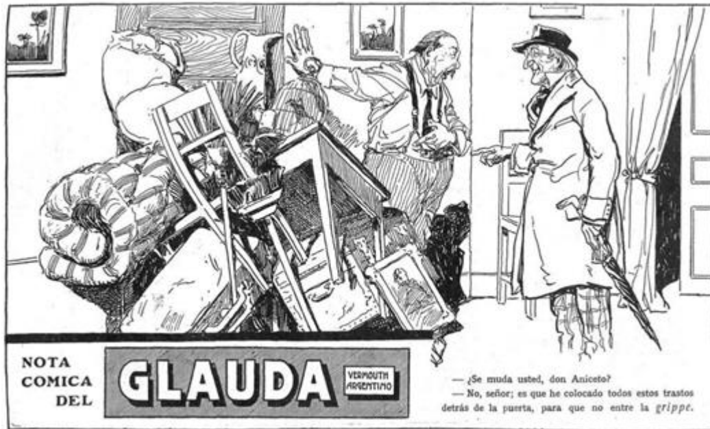
Figura 1 Glauda