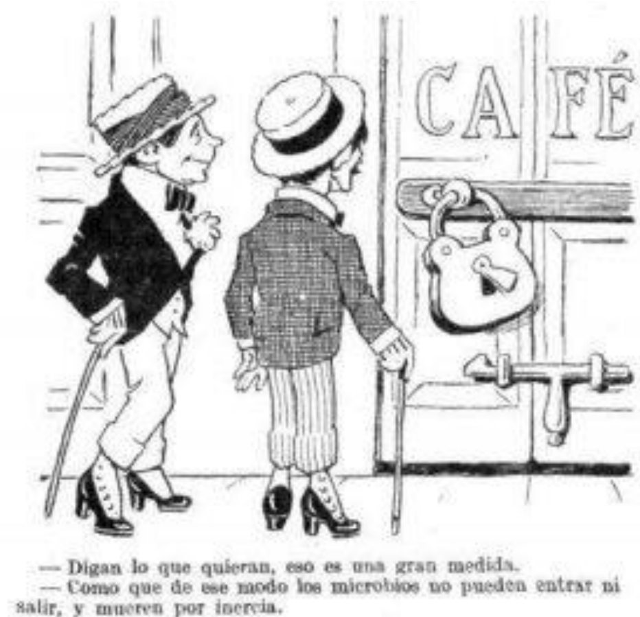
Figura 8 Cierre de cafés