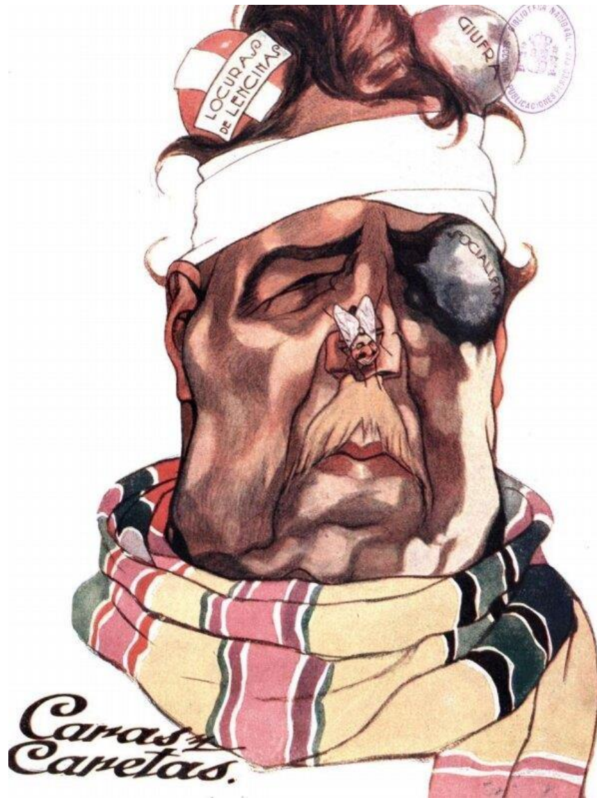
Figura 6 Tomá canela

Fuente: Caras y Caretas . Año XXI, N° 1049. Buenos Aires, 9 de noviembre de 1918.