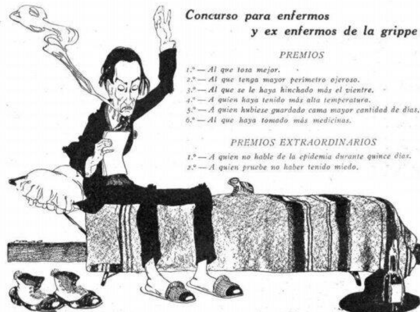
Figura 4 Concurso para enfermos