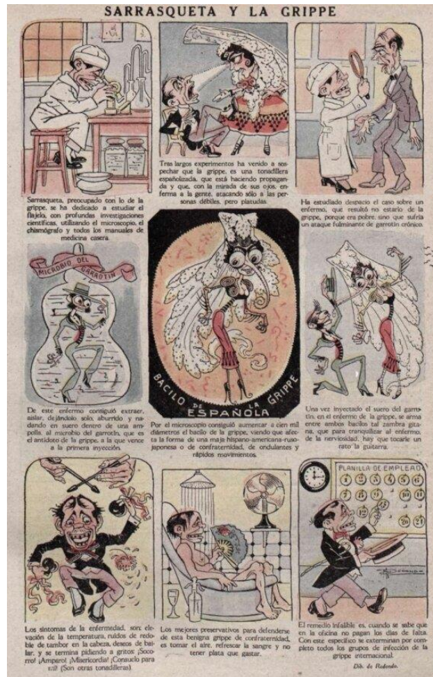
Figura 11 Sarrasqueta y la gripe

Fuente: Caras y Caretas . Año XXI, N° 1050. Buenos Aires, 16 de noviembre de 1918, p. 57.