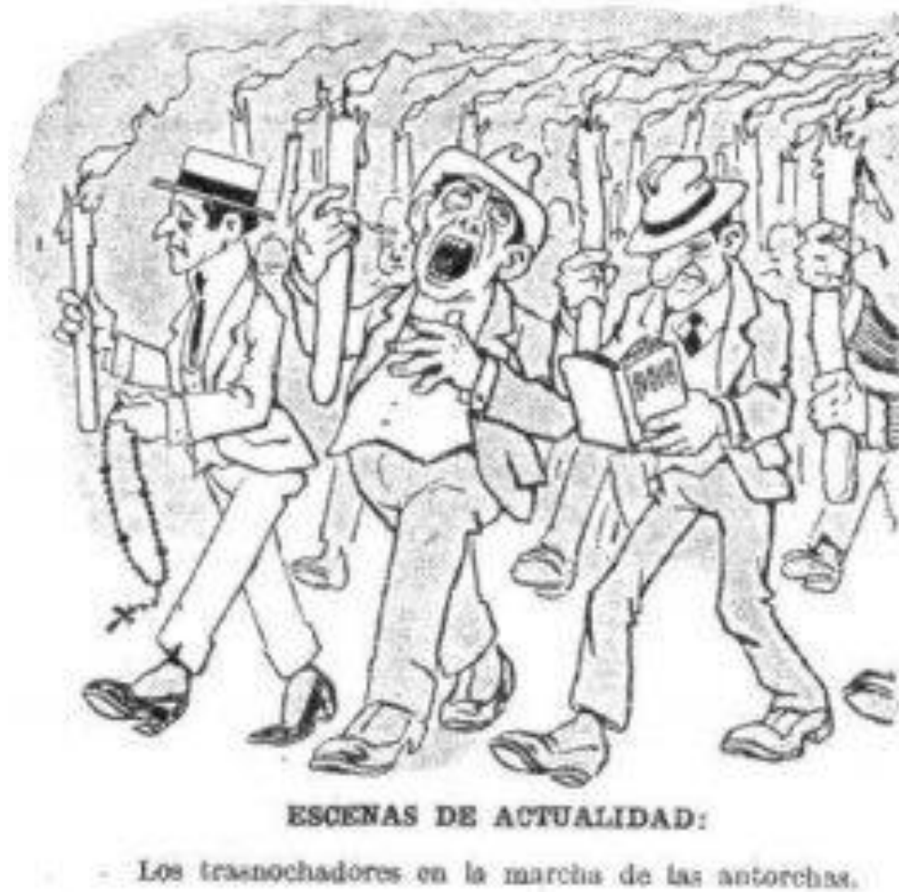
Figura 9 Manifestación de las antorchas