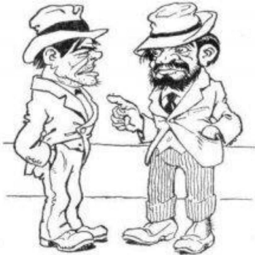
Figura 10 Me Río de Janeiro