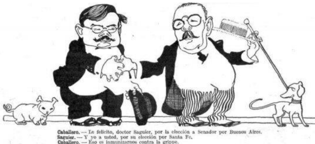
Figura 7 Emisión menor