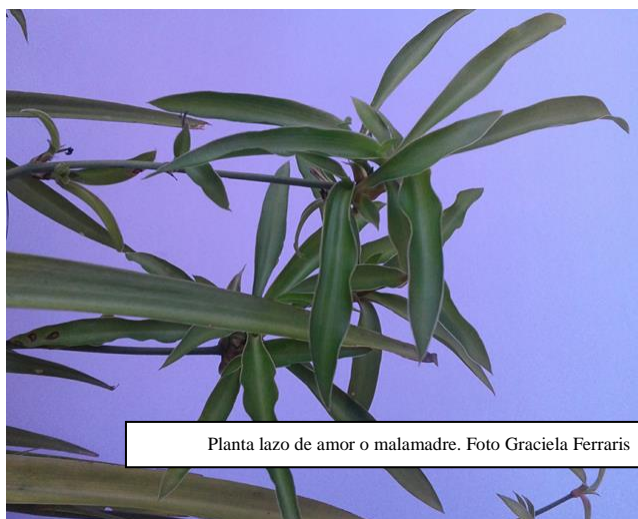
Planta lazo de amor o malamadre.

Malamadre es uno de los nombres que recibe la planta Chlorophytum comosum , vulgarmente conocida en nuestro país como “lazo de amor”. La figura es inversa al llamarse “malamadre”, ya que ese lazo en vez de mantener unido el brote, lo aleja de la planta madre para que eche raíz en otra tierra. En el caso de Malamadre,