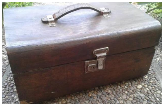
Valija en Malamadre . Foto Graciela Ferraris

que de economía. Como cita el epígrafe “todo lo que teníamos lo llevábamos en nuestras valijas”, en la voz de un pasajero de ese viaje y cada valija se convierte en el único espacio de certeza; ese solo objeto con el que trabajan los actores funciona a los efectos de la obra como un portador de memoria, como un sistema que conserva y acumula información (Lotman, 1996).