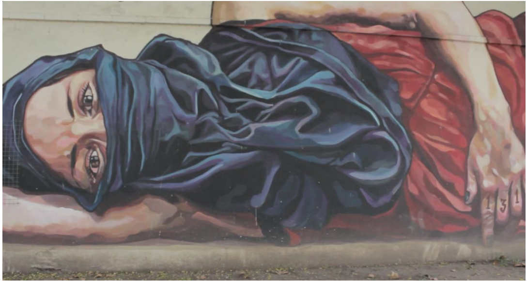
Mural Parque Las Tejas. Mariano Antedoménico. 2014.