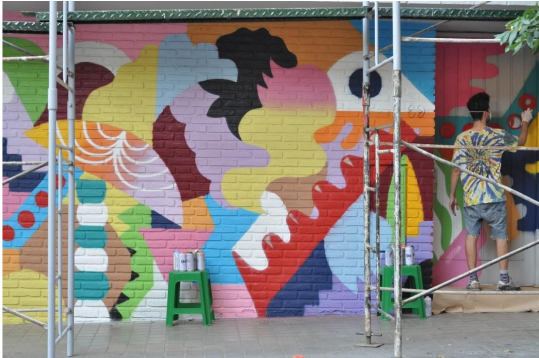
Mural barrio Nueva Córdoba. Mina Hamada-Zozen Bandido. 2016.