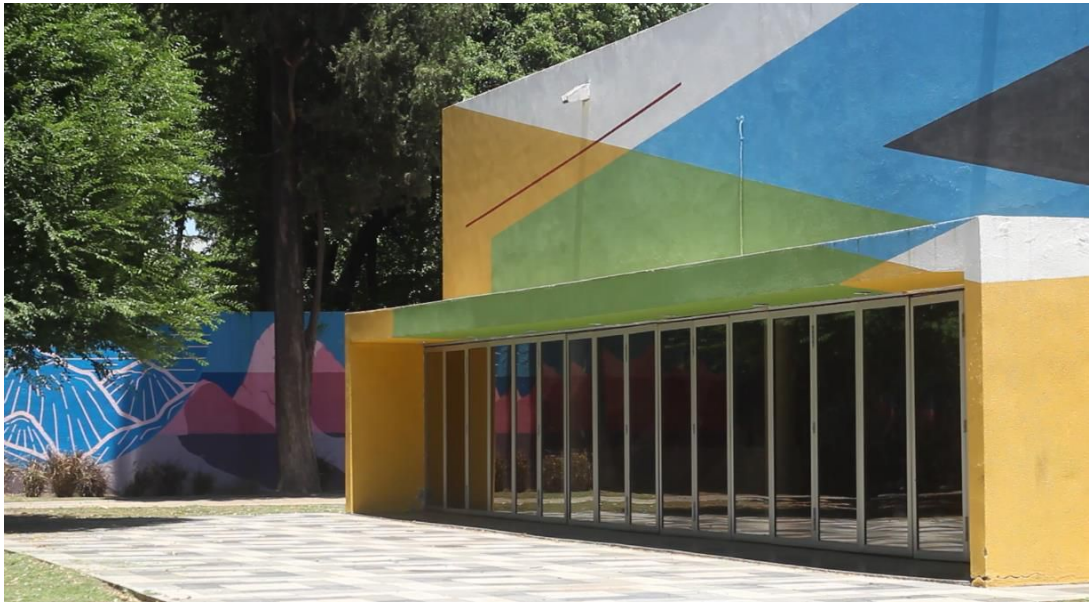
Mural Parque Las Tejas. Elián Chali. 2015