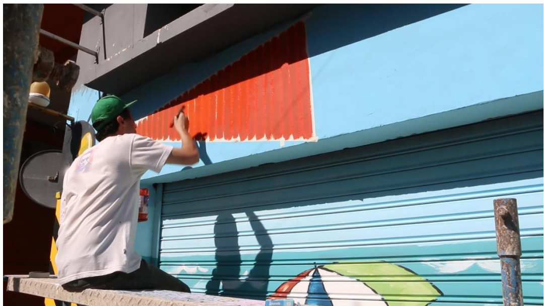
Mural barrio Centro. 5° Encuentro de Grafiteros y Muralistas Intercultural. 2016.