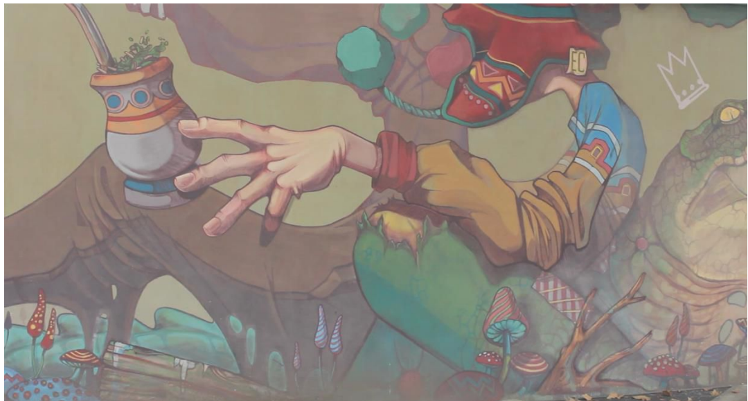
Mural Parque Las Tejas. Sebastián Zapata. 2014.