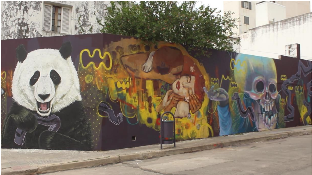
Mural barrio Nueva Córdoba. Pesk-Lolo-Marcus-Cristian Badaró. 2016.