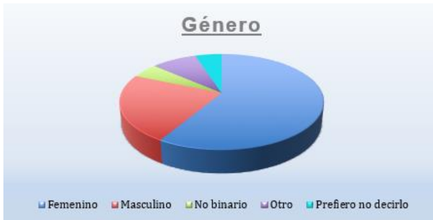
Gráfico B: Genero de los estudiantes de estudiantes de Enfermería que aprobaron la materia de Adulto y Anciano II de la Licenciatura en Enfermería en el año 2022.

Fuente: Primaria, Cuestionario auto-administrado.