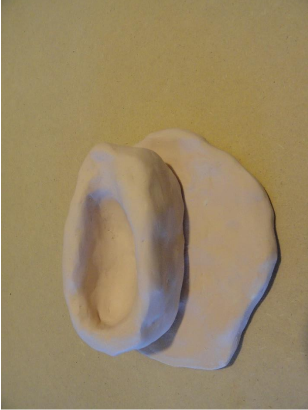
Fotografía de objeto que pertenece a Ejercicios I