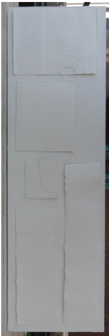
Gofrado en papel Fabriano. Medidas variables. 2014