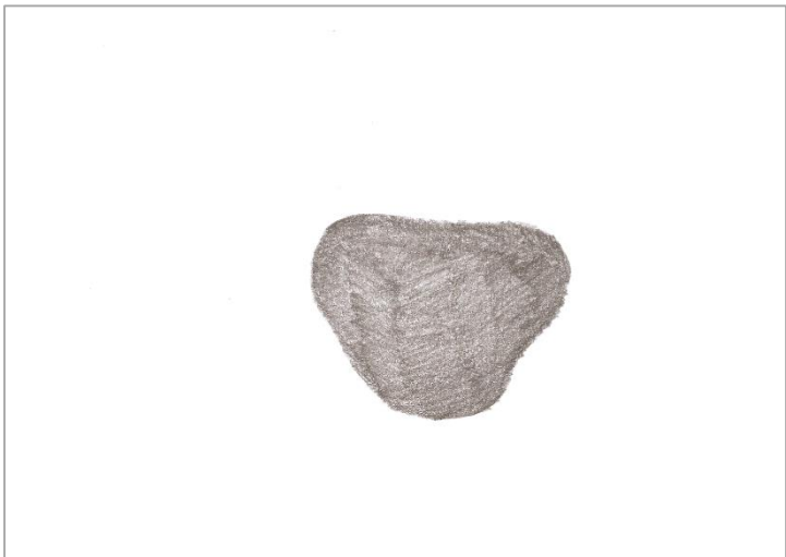
Dibujo que pertenece a Ejercicios I