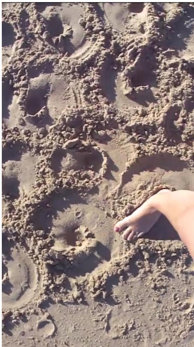
Captura de pantalla, video Círculos .