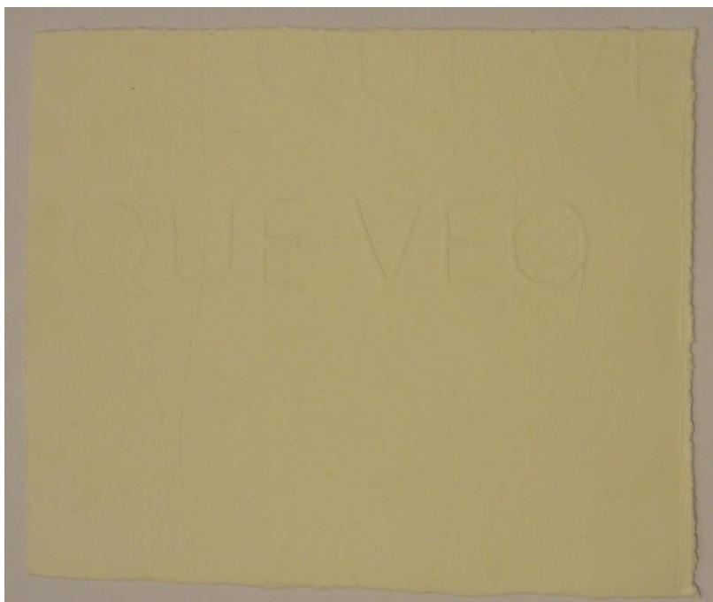
Fragmento. Papel Fabriano gofrado. 11,5 cm x 14 cm. 2014