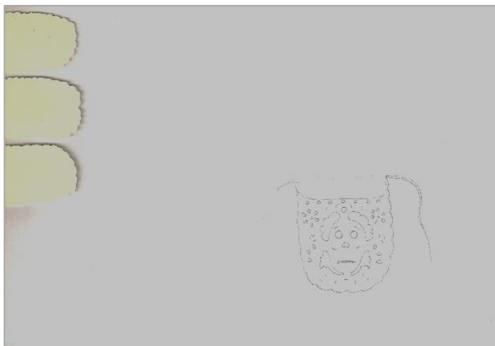
Grafito y papel sobre papel. 21 x 14,8 cm. 2013