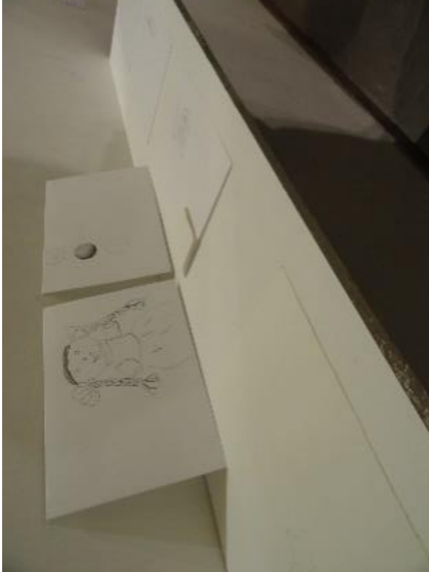
Montaje muestra de Cátedra POÉTICAS PERSONALES 13.