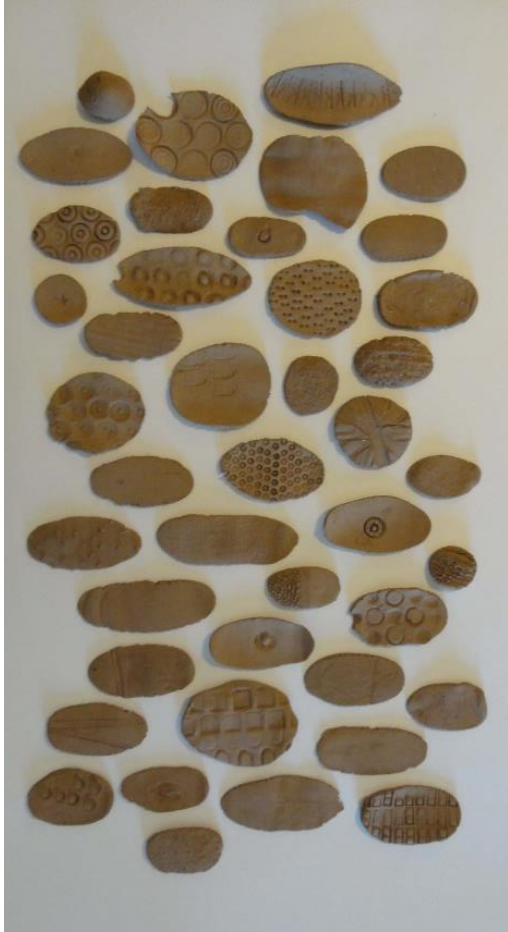
Arcilla marcada. Medidas variables. 2014