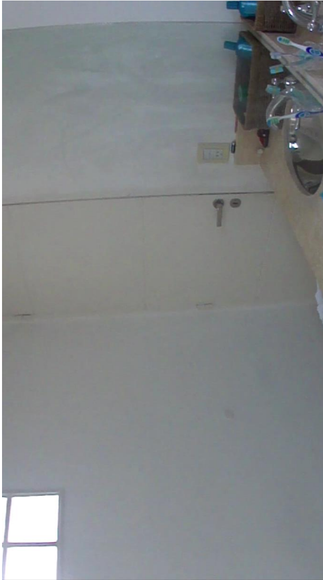
Captura de pantalla, vídeo Baño.