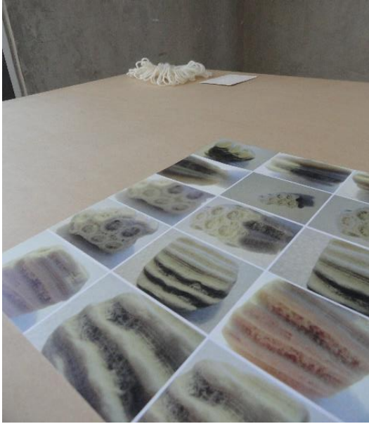
Fotografías, tejido amorfo, papel Fabriano escrito en braille. Medidas variables. 2014