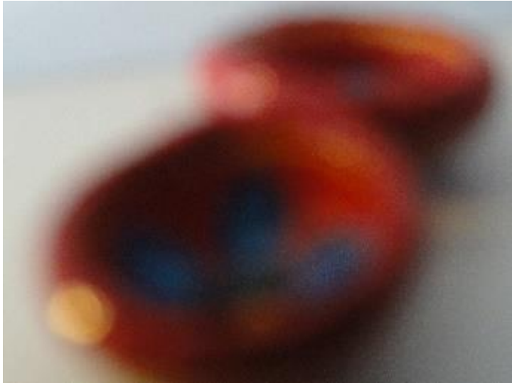
Fotografía que pertenece a Ejercicios I