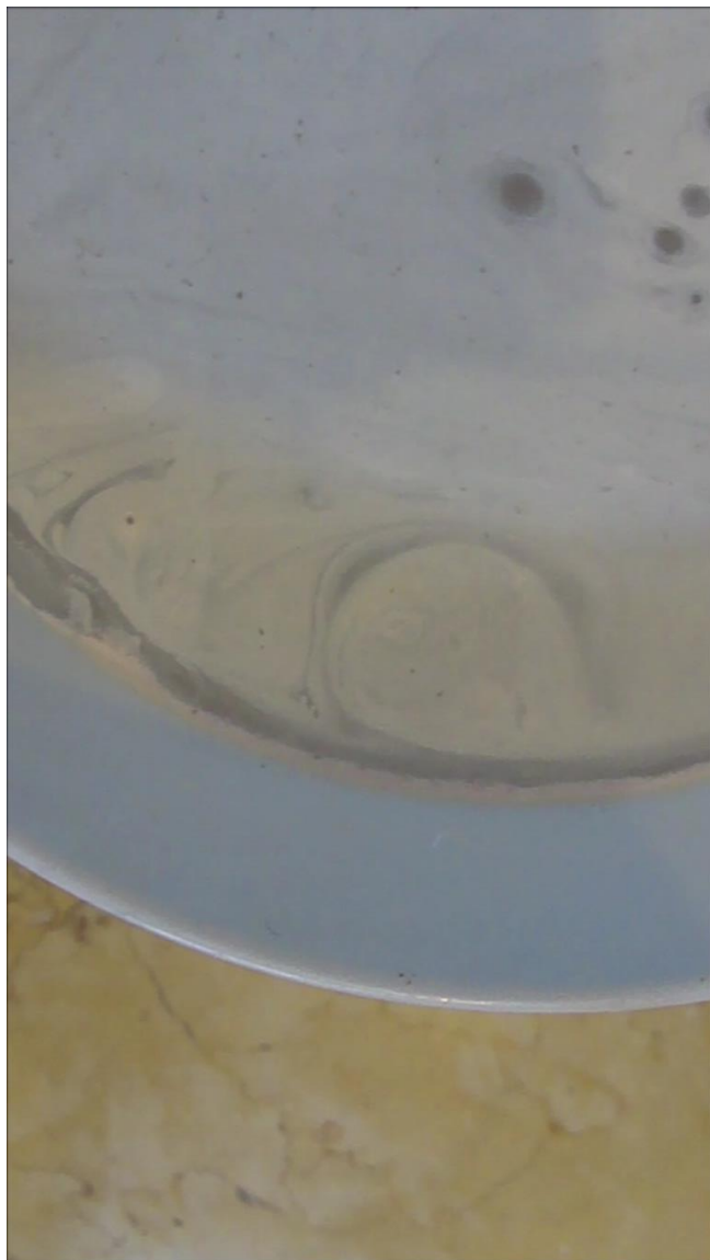
Captura de pantalla, vídeo Mancha .