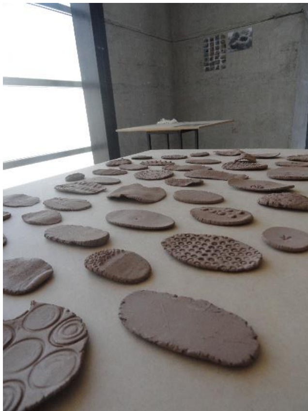
Parte del montaje de trabajos en el marco de PINTURA IV 2014