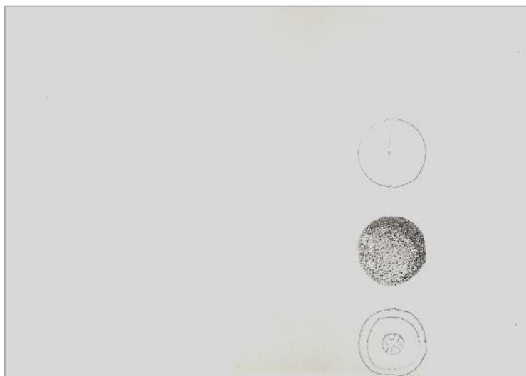
Grafito sobre papel. 21 x 14,8 cm. 2013

Algunos dibujos realizados en el marco de la cátedra Dibujo IV (2013)