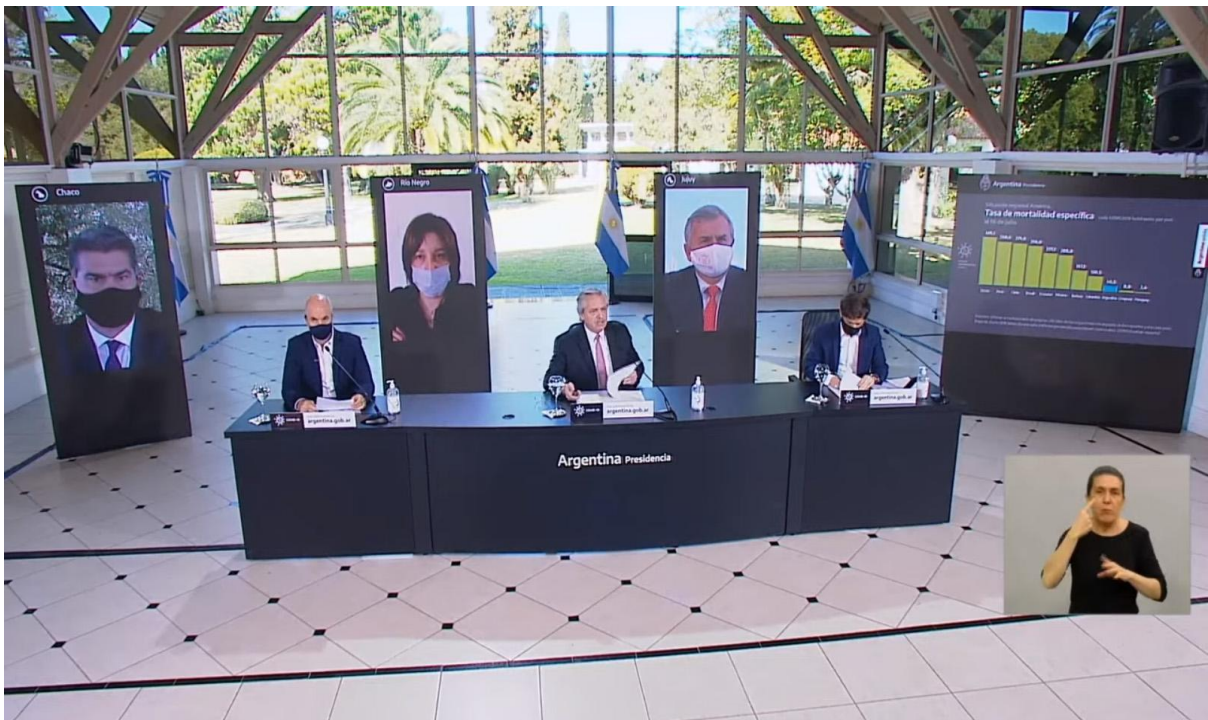
Horacio Rodríguez Larreta, Alberto Fernández y Axel Kicillof 17 de julio