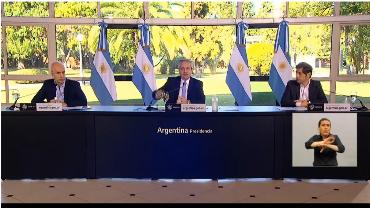
Horacio Rodríguez Larreta, Alberto Fernández y Axel Kicillof 26 de junio