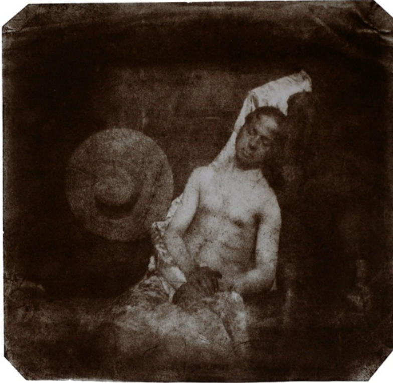
Hyppolite Bayard, "Le Noyé" ("El ahogado"), 1840 (dominio público)

Esta imagen muestra a un hombre semidesnudo, envuelto en una suerte de túnica, recostado con los ojos cerrados. Nada nos dice de su identidad, ni del motivo de su gesto. Mucho menos, si acaso llegamos a deducir que se trata de un muerto, de los motivos que llevaron a esa muerte. Bayard sabe esto y por eso agrega, en el reverso de una de las tres imágenes que realiza con este motivo, un texto que explica cómo debe ser leída la fotografía: