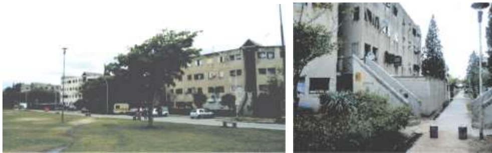
Figura 2: Planta, planimetría y fotografías del conjunto residencial SEP. Fuente: Elaboración propia.

Hogar Propio, se localiza al borde del área peri-central de la Ciudad, sobre una arteria con gran dinamismo en cuanto a comercio, equipamientos, etc. Se integra con 112 viviendas con una densidad de 95 viviendas por hectáreas, actualmente con desarrollos de vivienda dispuestas en 3 bloques paralelos de 4 pisos (pb+3) en un sector consolidado de dominancia residencial de vivienda unifamiliar. La propuesta se desarrolla en una sola manzana, administrativamente, se encuentra dividido en 3 administraciones (Figura 3).