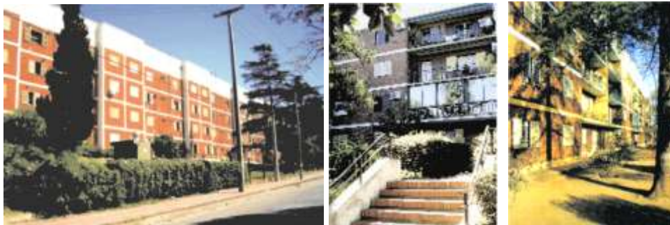
Figura 3: Planta, planimetría y fotografías del conjunto residencial Hogar Propio.